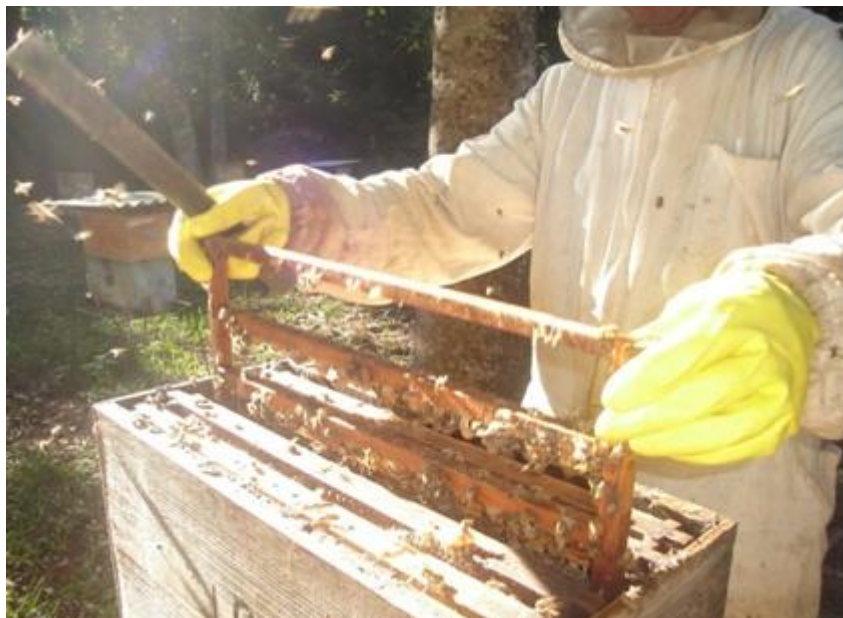
Fig. 1. Retirada do quadro porta-cúpulas para produção de rainhas.