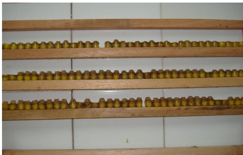
Fig. 2. Quadro porta-cúpulas com produção de geleia real.