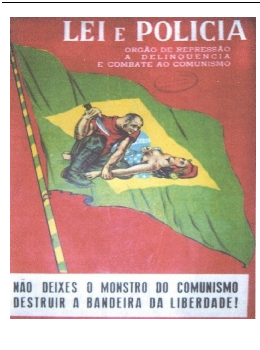
QUADRO 1 - Não deixes o monstro do comunismo destruir a bandeira da liberdade!