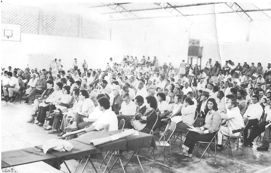
Encontro dos desabrigados do rio Paraná - Panorama- SP – Núcleo de Documentação Histórica “Honório de Souza Carneiro”, CPTL/UFMS.