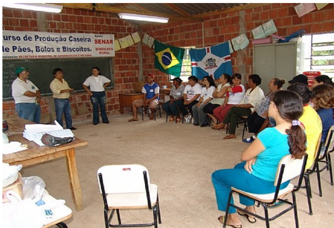
Curso realizado no Assentamento Pontal do Faia. Três Lagoas, 2005.