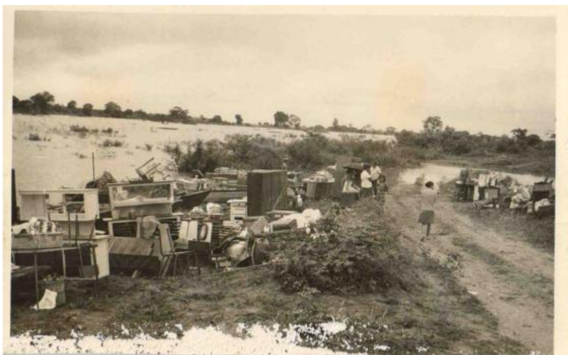
Moradores ribeirinhos a retirar seus pertences com a enchente de 1983 - Três Lagoas, 1983 – Núcleo de Documentação Histórica- CPTL/UFMS.