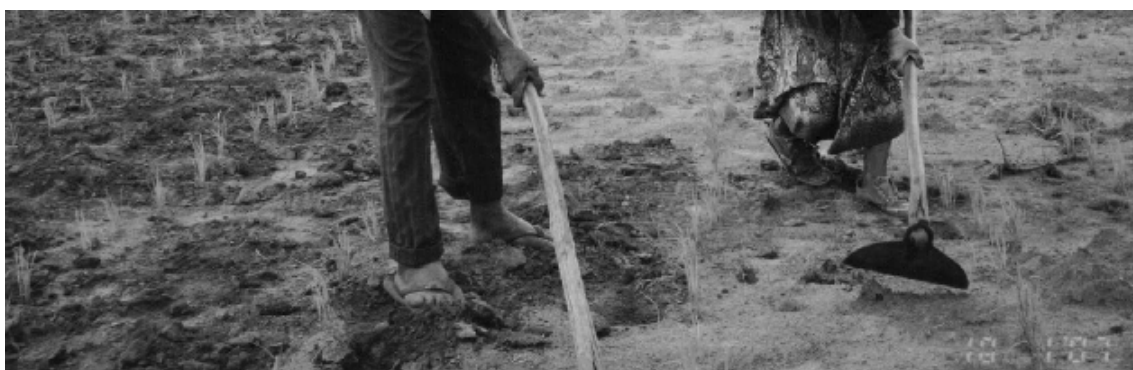
Figura 02- Casal de assentados. Pontal do Faia. 2008.

Isso porque nos levam a outro dado que consideramos um dos mais importantes desta pesquisa. Observando esta foto, mesmo sem cores, tirada no próprio assentamento, o que abstraímos dela: