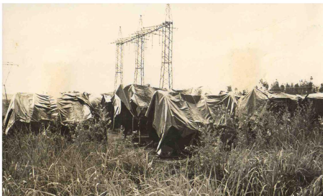
Acampamento em terras da CESP – Três Lagoas - Núcleo de Documentação Histórica “Honório de Souza Carneiro”, CPTL/UFMS.