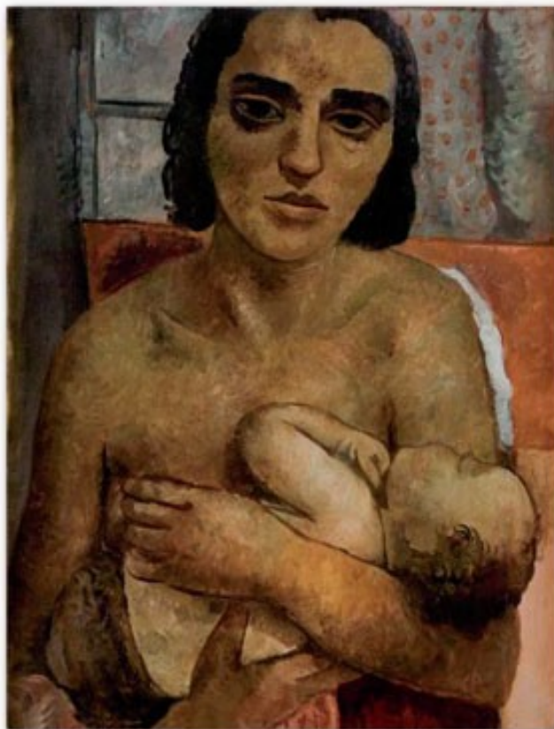
Figura 13. Maternidade (Lasar Segall, 1936).