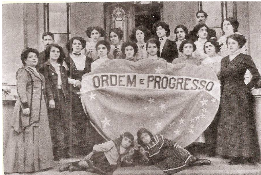
Figura 36. Alunas da Escola com parte da bandeira bordada por elas em 1909.

referiu-se. E as crianças, todas do sexo feminino, apresentam-se como se fossem miniaturas das professoras, dando-nos a impressão de que crescerão educadas pelos mesmos princípios e para os mesmos fins, ou seja, terão a “nobre” missão de transformar a pátria.