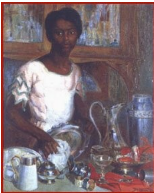
Figura 37. Limpendo Metais (Armando Vianna, 1923).

Se o trabalho doméstico nas famílias ricas era realizado pelas mulheres pobres e, em maioria, por ex-escravas, isto revela que, além da mulher pobre não poder ficar em casa cuidando dos filhos e do próprio lar, a mulher de família rica tinha quem fizesse o trabalho doméstico para ela.