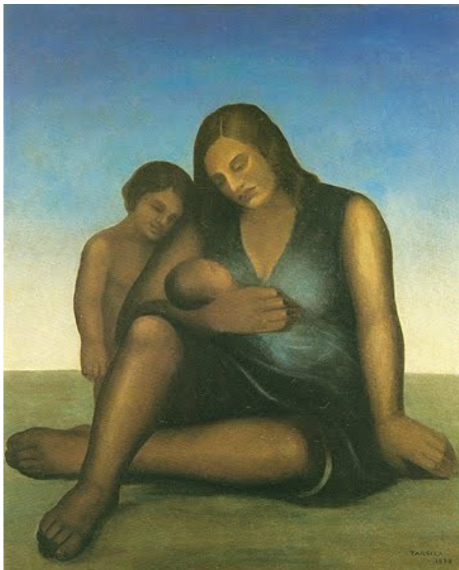
Figura 15. Maternidade (Tarsila do Amaral, 1938).