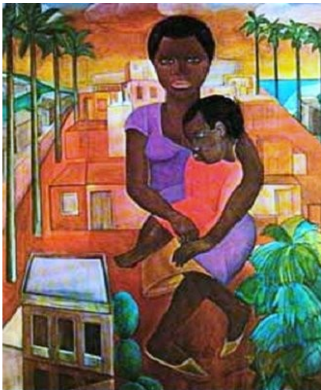
Figura 5. Morro Vermelho (Lasar Segall, 1926).