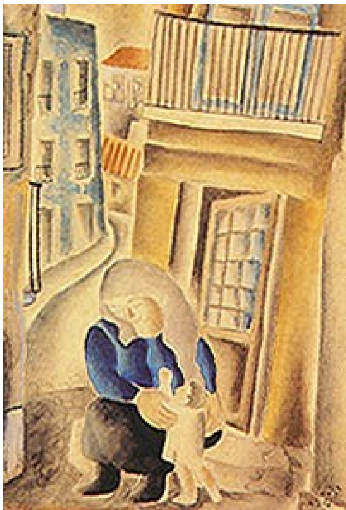
Figura 4. Maternidade (Emiliano Di Cavalcanti, década de 1920).

Embora, supõe-se pela vestimenta, a maternidade retratada por Eliseu Visconti fora pintada ao “estilo burguês”, mães brancas, negras, jovens, ricas e pobres, como exemplo do que vinha acontecendo na sociedade brasileira, foram exaltadas e retratadas pela arte, independente de etnia e classe social. Como podemos observar nas telas a seguir.