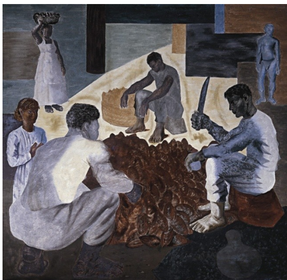
Figura 29. Cacau (Candido Portinari, 1938).