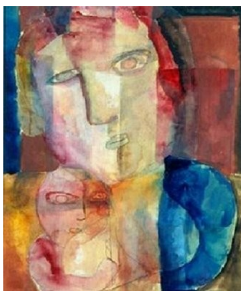
Figura 12. Maternidade (Lasar Segall, 1922).

E sendo a arte uma forma de expressão do homem, que traz as marcas de seu tempo e contexto histórico, a mulher, com uma criança no colo, como exaltação à maternidade, serviu de inspiração aos pintores brasileiros em todas as décadas do período focalizado neste estudo, como podemos observar nas telas a seguir.