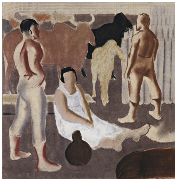
Figura 28. Gado (Candido Portinari, 1938).