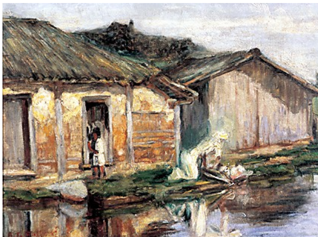
Figura 39. A Lavadeira (Anita Malfatti, 1920).