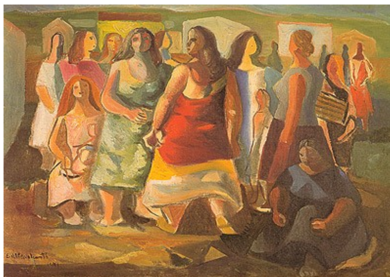
Figura 22. Mulheres protestando (Emiliano Di Cavalcanti, 1941).

Desta forma, o discurso da higiene mental ganhava força e, também nas reuniões e reivindicações por melhores condições de trabalho da classe operária, a mulher era condenada por trabalhar. Apesar de, na interpretação de Pena (1981) e Fausto (2000), a presença das mulheres trabalhadoras das fábricas, nas greves e protestos operários na primeira metade do século XX, fosse tímida e desorganizada, esta participação foi retratada pelo pintor Emiliano Di Cavalcanti (Figura 22).