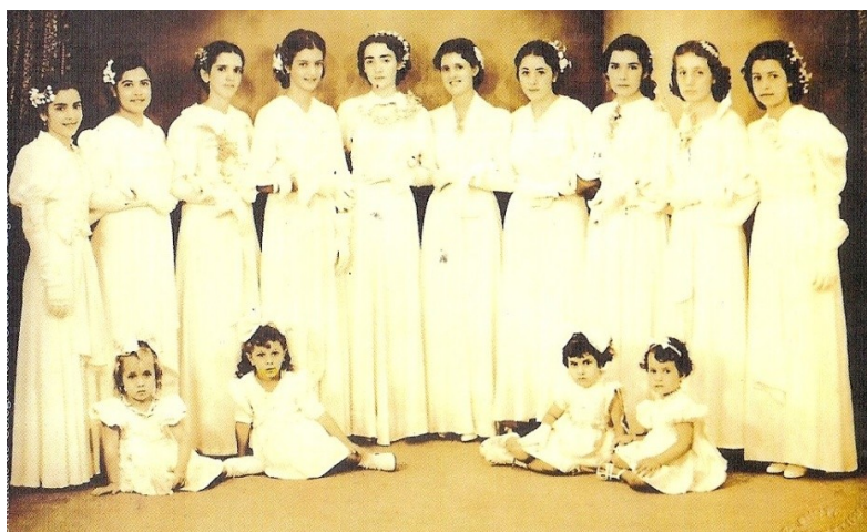
Figura 35. Turma de Formandas do Colégio Nossa Senhora das Lágrimas, Uberlândia – MG, 1937.

Lar e escola, eis a maior preocupação dos governos, dos instituidores, dos mestres e educadores diplomados ou não. O lar e a escola são oficinas de onde hão de sair bons e maus elementos sociais, o homem e a mulher, o homem para os grandes empreendimentos, a mulher para auxiliar em tudo, porque tem ela a capacidade pra todas as atividades, com a vantagem de ser mais honesta e mais caprichosa na prática de dever, de ter mais sentimento e mais amor às empresas a que se dedica (Andrade, 1925, p. 265, grifo nosso).