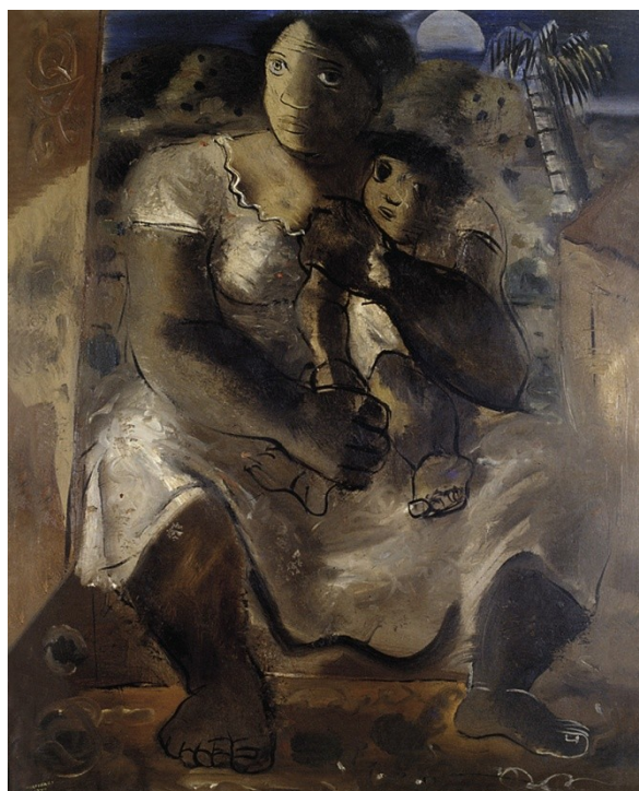
Figura 16. Mãe Preta. (Candido Portinari, 1940).