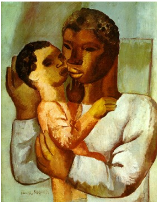
Figura 7. Mãe Negra (Lasar Segall, 1930).