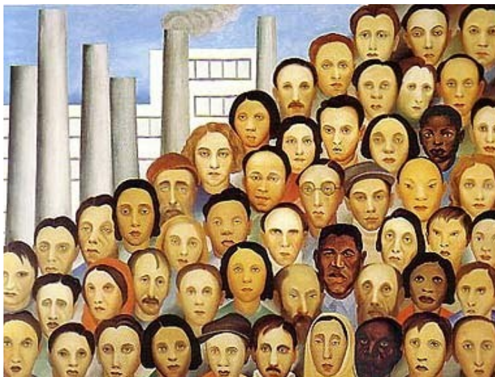
Figura 20. Operários (Tarsila do Amaral, 1933).

Em outra tela (figura 21), Portinari retratou a mulher adequando-se à condição de mãe e trabalhadora, evidenciando a impossibilidade da mulher da classe trabalhadora de se manter em casa cuidando apenas dos filhos e dos afazeres domésticos. As altas taxas de mortalidade 17 , a carência de mão de obra e a própria necessidade de sobrevivência eram fatores que impediam a mulher de se restringir ao ambiente doméstico e, portanto, seguir os preceitos higienistas.