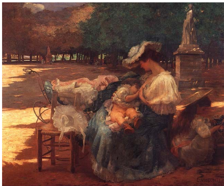
Figura 3. Maternidade (Eliseu D'Angelo Visconti, 1906).

A mãe deve ser sempre mãe, tanto na alta sociedade como na plebe (Moncorvo Filho, 1925, p. 6).