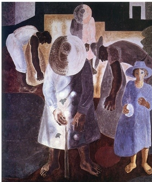
Figura 27 Algodão (Candido Portinari, 1938).