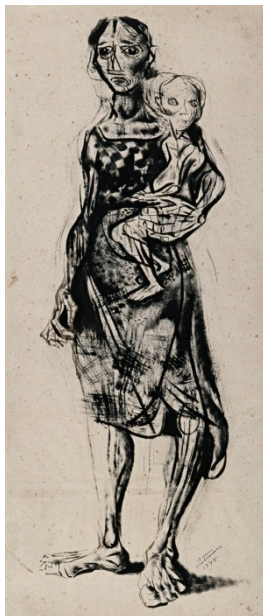
Figura 19. Retirante Grávida (Candido Portinari, 1945).

Quase três décadas após, Portinari ilustra a situação desta mulher referida por Gouvêa, embora o cenário seja tão ou mais dramático que “a labuta da oficina”. Na tela intitulada Retirante Grávida (Figura 19), Portinari retrata a difícil situação da seca, o sofrimento e a penúria da mulher retirante em período de gestação.