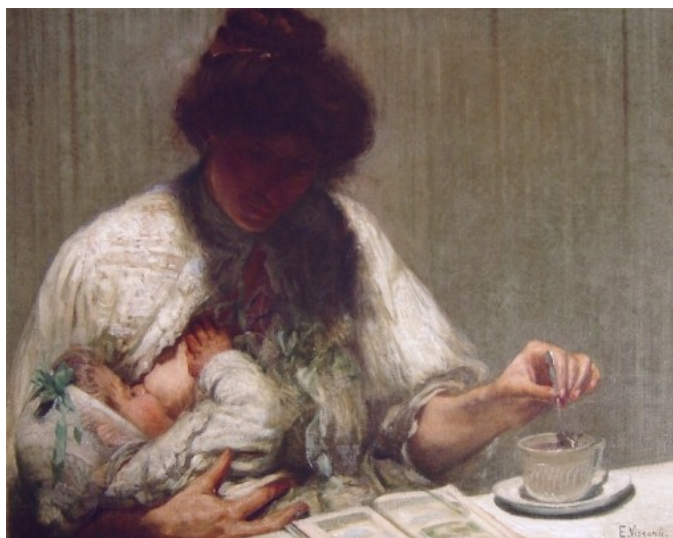
Figura 11. Maternidade (Eliseu Visconti, 1905).

No ideário da higiene mental, se a mulher não cuidasse, educasse e orientasse os filhos com a devida dedicação, essas crianças seriam os futuros adultos delinquentes, alcoolistas e desocupados da sociedade. Para Souza (1942), “a maior parte das crianças mal cuidadas e vigiadas torna-se viciada ou delinquente, pela longa ausência dos pais que trabalham fora do ambiente familiar” (p. 11).