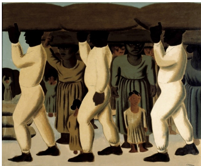
Figura 25. Colonos carregando café (Candido Portinari, 1935).

O modelo de família proposto pelo ideário da higiene mental, em que a mulher estava reservada ao espaço doméstico, cuidando dos filhos, contrapõe-se ao fato de que, muitas vezes, todos os membros da família pobre – mãe, pai e filhos – trabalhavam e viviam fora do espaço doméstico, como mostra a tela intitulada Colonos carregando café (Figura 25).