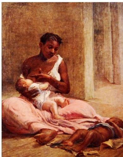
Figura 9. Mãe Preta (Lucílio de Albuquerque, 1912).

Tarsila do Amaral, pintora brasileira, em sua obra intitulada A Negra 13 retratou uma mulher negra com seio grande, referindo-se a um dos papéis da mulher escrava.