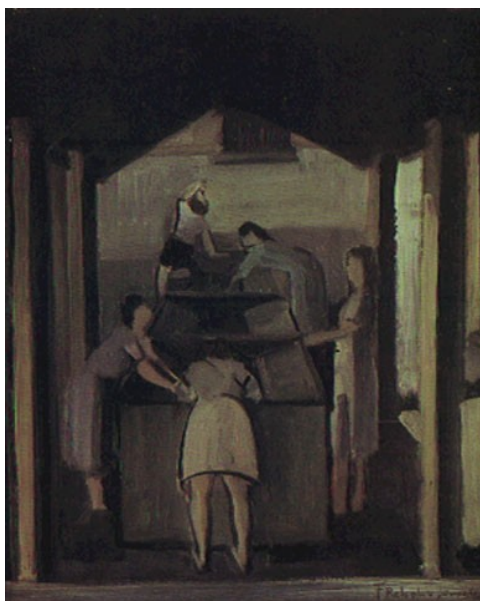
Figura 40. Lavadeiras (Francisco Rebolo, 1937).

Observamos na tela de Anita Malfatti, intitulada A Lavadeira (Figura 39), que a mulher está lavando roupa na beira de um rio ou córrego. Segundo Matos (1995), nos fins do século XIX e início do século XX, a maioria das casas não contava com instalações de água encanada, por esta razão, as mulheres lavavam as roupas em rios ou em lavanderias, como demonstra a tela intitulada Lavadeiras (Figura 40), do pintor Francisco Rebolo.