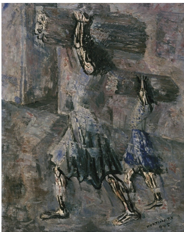
Figura 34. Mulher carregando lenha (Candido Portinari, 1945).

Apresentamos as telas de Antonio Ferrigno, intitulada Florada de Café , (Figura 42) e de Candido Portinari, intitulada Mulher carregando lenha , (Figura 43), no intuito de destacar