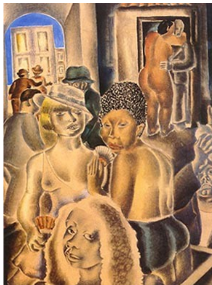
Figura 42. Manguê (Di Cavalcanti, 1929).