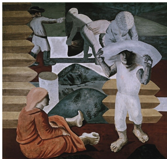
Figura 30. Café (Candido Portinari, 1938).

Nas telas intituladas, Fumo , Café e Gado , a figura da mulher aparece sentada, supostamente, demonstrando cansaço pela realização do trabalho pesado, como também pode ser observada na tela intitulada Café de 1935, apresentada anteriormente (Figura 23). Nas telas intituladas Cacau e Algodão , a criança é retratada pelo pintor, revelando que nem mulheres e crianças eram poupadas do trabalho.