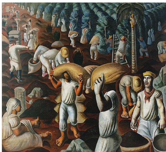
Figura 23: Café (Candido Portinari, 1935).

torno da exportação dos produtos agrícolas, apesar das crises econômicas em períodos diversos. No setor rural, a mulher também participava do quadro de trabalhadores. A tela intitulada Café (Figura 23) de Candido Portinari, retrata a presença feminina na agricultura. Observamos a figura da colona e, ao fundo, mulheres negras com sacas de café na cabeça. Os trabalhadores livres e assalariados dos cafezais eram, em maioria, ex-escravos e imigrantes.