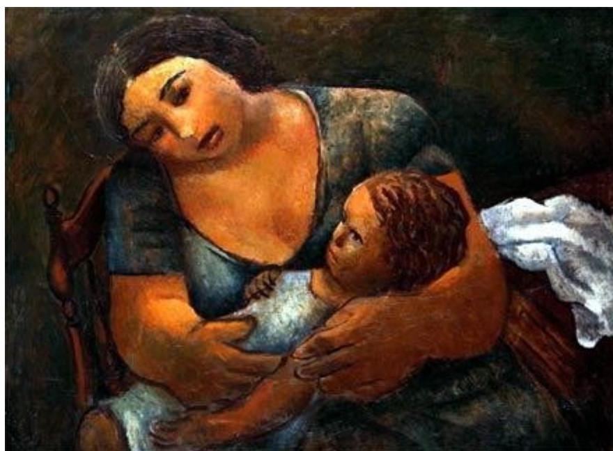
Figura 14. Maternidade (Emiliano Di Cavalcanti, 1937).