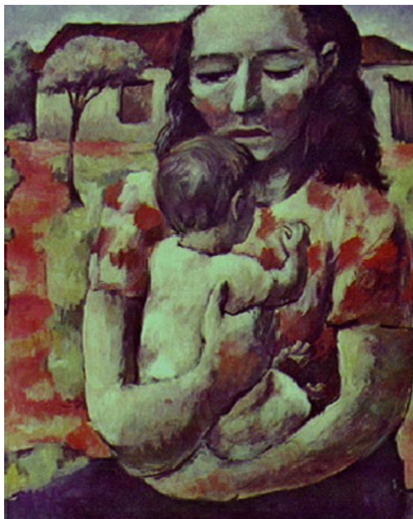
Figura 17. Maternidade (Carlos Prado, 1946).

As preocupações da época acerca dos cuidados maternos, mais especificamente da elite intelectual brasileira, não se restringiram à amamentação oferecida pela mãe biológica, os períodos iniciais da vida eram de interesse médico, inclusive, o da gestação, que discutiremos a seguir.