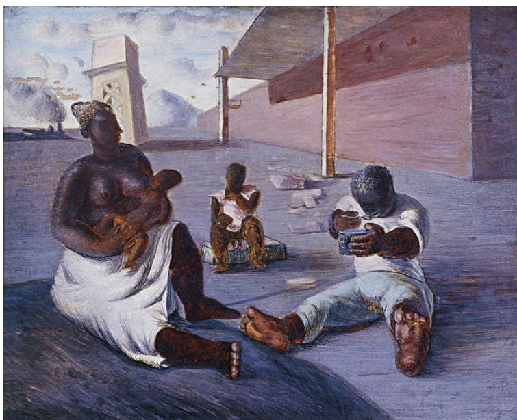
Figura 21. Operário (Candido Portinari, 1934).

Em outra tela (figura 21), Portinari retratou a mulher adequando-se à condição de mãe e trabalhadora, evidenciando a impossibilidade da mulher da classe trabalhadora de se manter em casa cuidando apenas dos filhos e dos afazeres domésticos. As altas taxas de mortalidade 17 , a carência de mão de obra e a própria necessidade de sobrevivência eram fatores que impediam a mulher de se restringir ao ambiente doméstico e, portanto, seguir os preceitos higienistas.