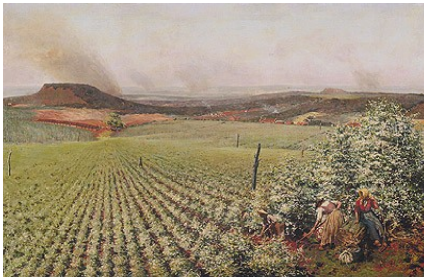
Figura 33. Florada de Café (Antonio Ferrigno, 1903).

e, ao mesmo tempo, uma alegoria, por ser, juntamente com o martelo, o símbolo do Partido Comunista” (p. 32).