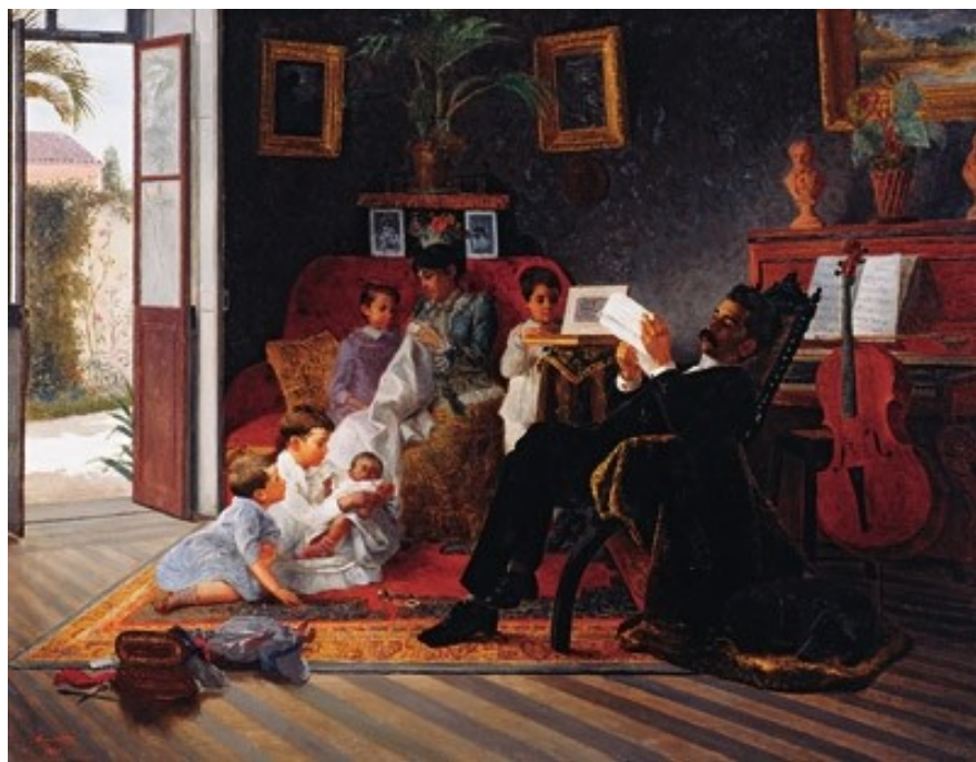
Figura 1. Sem título - Cena de Família de Adolfo Augusto Pinto (José Ferraz de Almeida Junior, 1891).