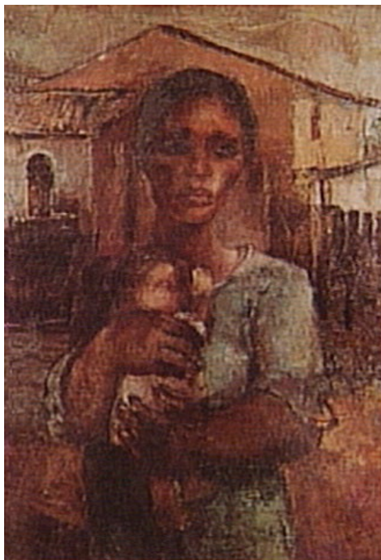
Figura 8. Jovem Mãe (Yolanda Mohalyi, 1943).