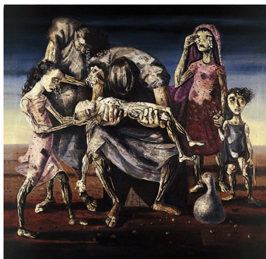
Figura 24. Criança Morta (Candido Portinari, 1944).

Além da mulher, a figura da criança aparece em várias obras de Portinari. Crianças trabalhando, crianças desnutridas, crianças mortas foram temas explorados por este pintor, demonstrando, assim, a pobreza, a miséria e as más condições de vida dos brasileiros. Uma delas é a tela intitulada Criança Morta (Figura 24).