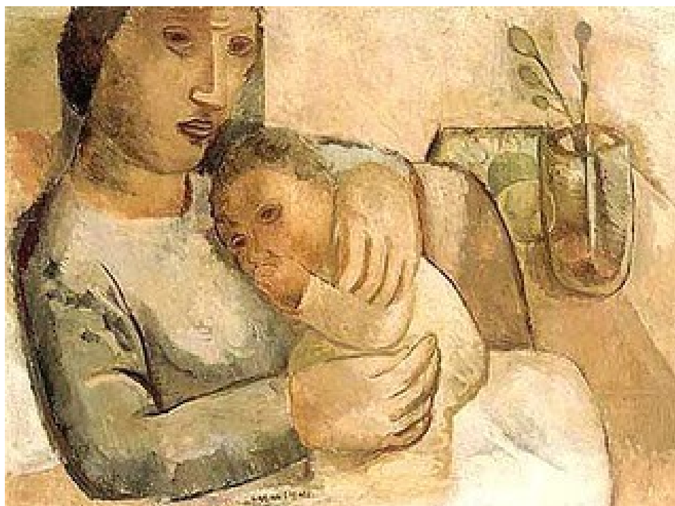
Figura 6. Maternidade (Lasar Segall, 1931).