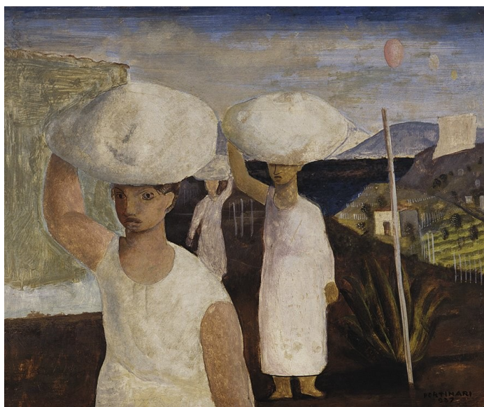
Figura 38. Lavadeiras (Candido Portinari, 1937).

O trabalho da mulher como lavadeira também foi retratado pelos pintores brasileiros, como nas telas, a seguir, de Candido Portinari (Figura 38) e Anita Malfatti (Figura 39).