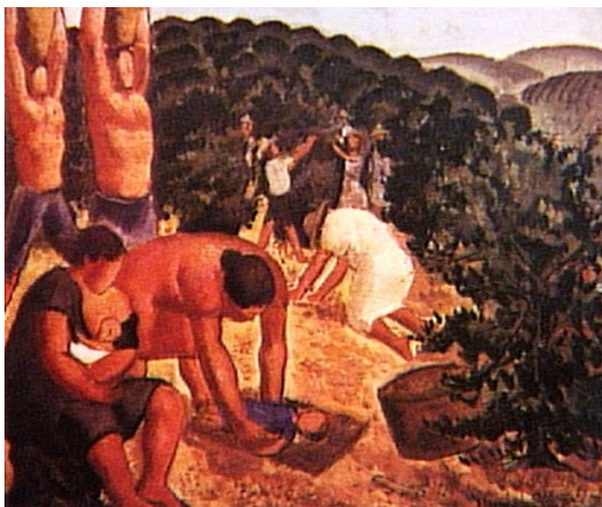
Figura 31. Café-colheita (Quirino Campofiorito, 1930).

Na obra intitulada Café-colheita (Figura 31), o que nos chama a atenção é a presença de duas mulheres acompanhadas por dois bebês, supostamente seus filhos. A arte testemunha que até no trabalho do campo, as mulheres não podiam restringir-se ao lar e, menos ainda, seguir os preceitos da higiene física e mental recomendados pelos médicos.