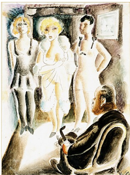
Figura 41. Bordel (Emiliano Di Cavalcanti, década de 30).