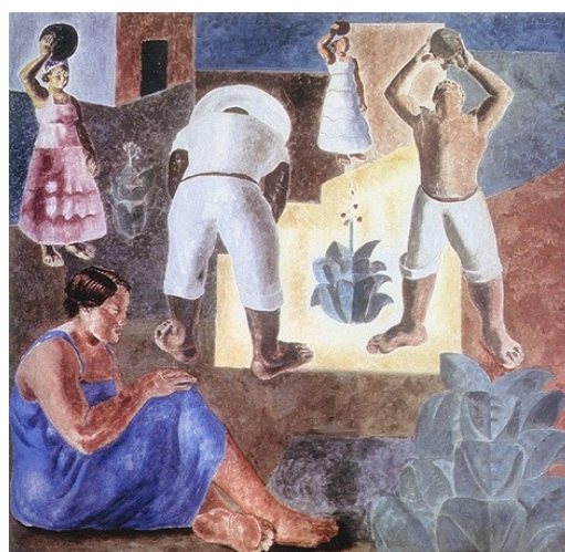
Figura 26. Fumo (Candido Portinari, 1938).

E não foi somente nas colheitas e plantações de café que Portinari registrou a participação da mão de obra feminina e infantil no campo. Em 1938, ele realizou uma série de pinturas para o prédio do Ministério da Educação e Cultura (MEC) do Rio de Janeiro, abordando a temática “Ciclos Econômicos 18 ”. Dentre as doze telas pintadas, selecionamos aquelas em que o pintor registra a participação feminina.