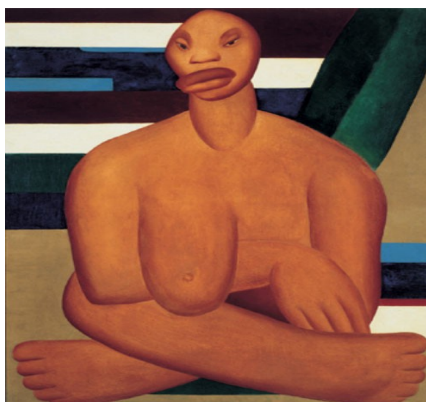
Figura 10. A Negra (Tarsila do Amaral, 1923).

Tarsila do Amaral, pintora brasileira, em sua obra intitulada A Negra 13 retratou uma mulher negra com seio grande, referindo-se a um dos papéis da mulher escrava.