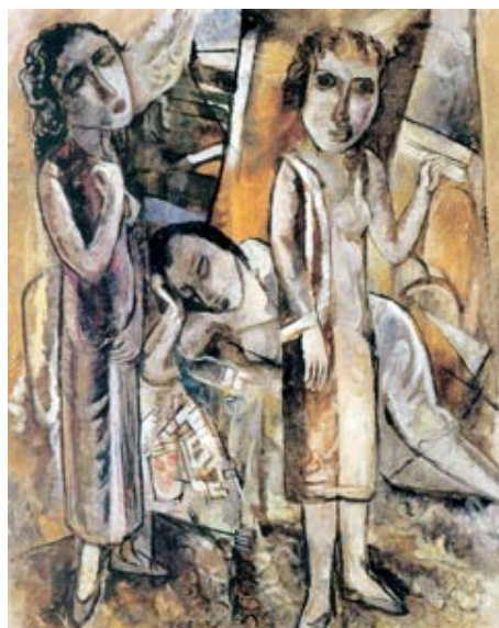
Figura 43. Grupo de Manguê na Escada (Lasar Segall, 1928). Figura 44. Interior no Manguê (Lasar Segall, 1949).

Oswald de Andrade (1890 – 1954) descreveu, em sua obra intitulada O Santeiro do Manguê , escrita entre 1935 e 1950, a vida das mulheres no manguê.