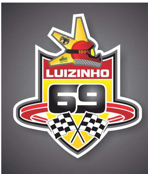
Figura 133 - Símbolo de um piloto de Curitiba/PR

Quando me refiro aos aspectos da equipe nesse processo de ressignificação e dos símbolos utilizados percebo, também, as tentativas das equipes em diferenciar-se das demais, bem como, em valorizar a sua ladeira em relação às outras. Um caso é uma equipe da região de Curitiba/PR que passou a postar vídeos dos tombos e a relacionar o nome da equipe, aos