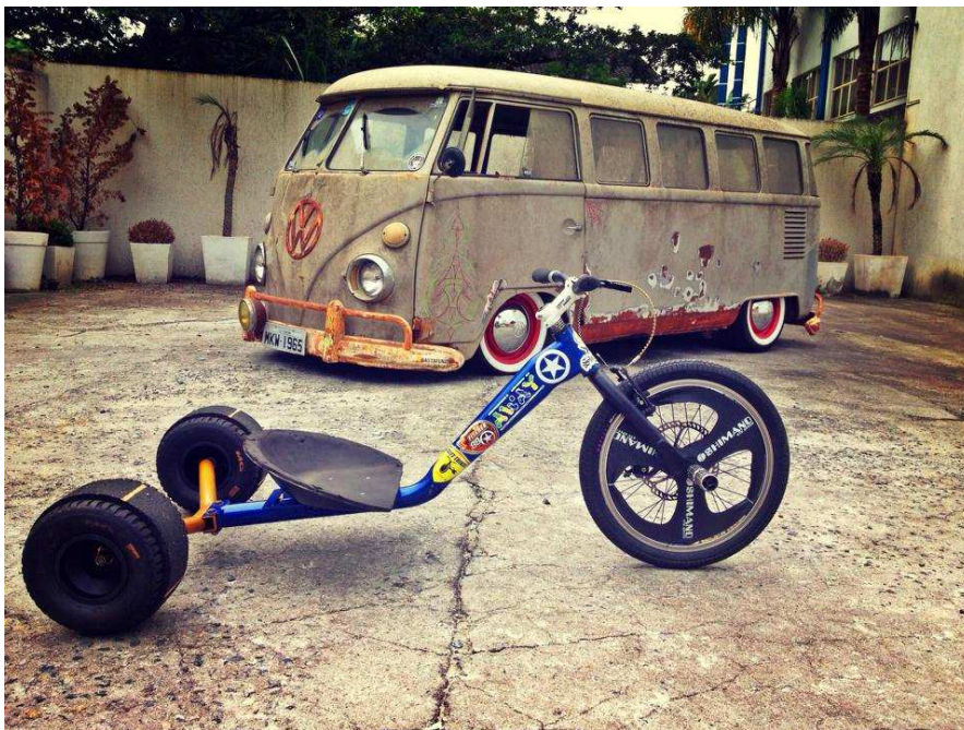
Figura 2 - Modelo de Trike

5