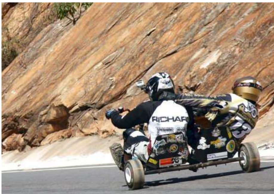
Figura 4 - Trike Duplo Simples

Uma das adaptações que me chamou a atenção foi a criação do trike duplo, o qual pode ser simples, desenvolvido com a finalidade de que duas pessoas descem a ladeira juntos. Ou ainda, este trike duplo pode ser modificado com adaptações que permitam que indivíduos portadores de deficiência física sejam integrados à prática e interajam com as outras pessoas. No interior de São Paulo, em São Bernardo dos Campos, a utilização destes modelos com adaptações para pessoas portadoras de necessidades especiais é muito comum.