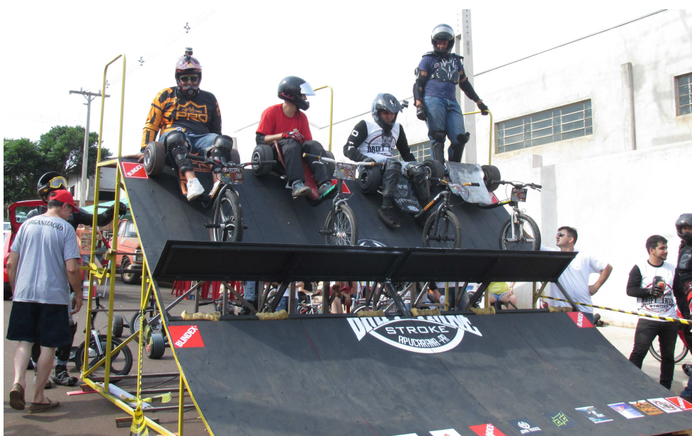
Figura 177 - Rampa de largada da equipe de Apucarana/PR

Algumas equipes, na intenção de diferenciar-se das demais personalizam suas rampas, ou mesmo, fabricam rampas com medidas superiores, como o caso da rampa ilustrada na imagem que segue. E isso afeta diretamente no espaço utilizado pela equipe na cidade, seja na questão do tráfego ou na imagem que as pessoas constroem sobre a ladeira diferenciando-a das demais. No caso da rampa usada como exemplo, há a vinculação da ladeira desta equipe com a “rampa monstro”, como chamam.