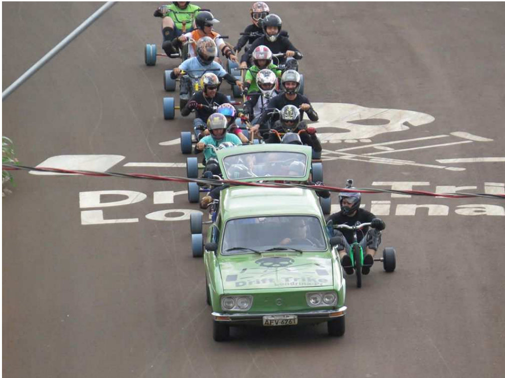
Figura 10 – Símbolo da equipe de Londrina pintado na rua do bairro Fonte: Família Drift Trike Londrina-PR 20

No entanto, ao observar mais de perto percebi que o sentido maior do símbolo não era para expressar esse sentimento de posse para as pessoas que conviviam no espaço, mas sim, para diferenciar a sua ladeira das demais ladeiras utilizadas para as descidas de trike . O sentimento maior por de trás da ação era do “faz teu nome”. Pelo o que eu compreendi, a expressão “faz teu nome” é usada no meio do Trike para se referir a ações que as pessoas ou equipes realizam com a intenção de adquirir uma notoriedade e diferenciação dentro do meio do Trike . Mas, essa notoriedade não é momentânea, a intenção é conquistar um “espaço social” diferenciado e de mantê-lo.