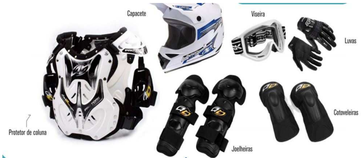
Figura 6 - Equipamentos de segurança

2 – O cumprimento das regras deve ser feito por entidades oficiais. O cumprimento das regras e a fiscalização dos resultados são de responsabilidade dos organizadores, seja da NDT ou das Ligas. Uma questão que é muito cobrada e é padronizada nas regras da NDT e das Ligas é o uso dos equipamentos de segurança. A realização deste esporte é perigosa, uma vez que na descida atingem velocidades acima de 60 km/h, e dependendo da ladeira podem chegar a 90 km/h; e na subida um trike pode bater no outro provocando a queda das pessoas. Em todos os campeonatos a não utilização de qualquer um dos equipamentos de segurança gera a imediata desclassificação do piloto. Essa medida foi adotada devido ao aumento do número de acidentes graves durante as descidas e, principalmente, após a primeira morte durante a prática, a qual ocorreu no Brasil, no interior de São Paulo. Além dos equipamentos obrigatórios, ilustrados a seguir, muitos pilotos estão utilizando o macacão de MotoCross como auxílio na proteção.