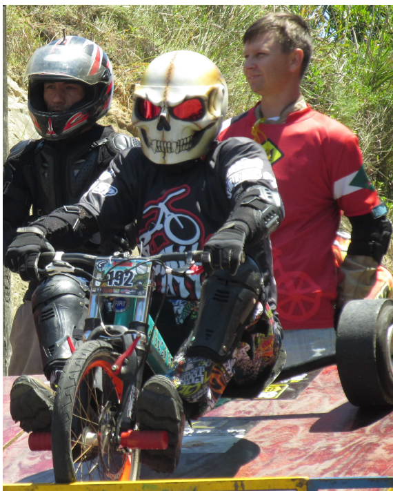
Figura 155 - Capacete com modificações (piloto de São Paulo/SP)