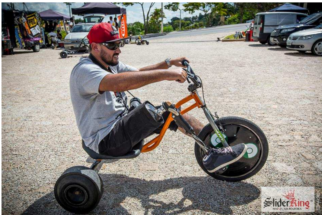
Figura 188 - Campeonato Mundial de trike SliderKing (etapa Brasil) 21