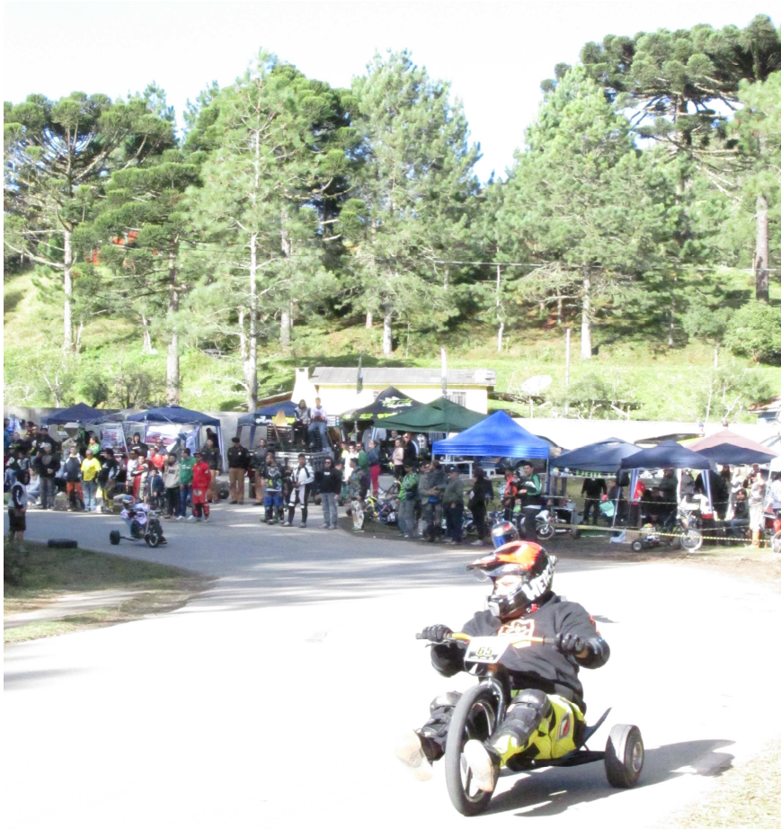
Figura 9 - Local utilizado para assistir o campeonato e de espera pelos pilotos (GP da Graciosa/PR)

regionais; se uma equipe escolheu determinado lugar para colocar a sua tenda e o banner de sua equipe, lá permanecerá, e isso será respeitado pelos membros das demais equipes. Se no domingo uma equipe usar o espaço que foi utilizado por outra equipe no sábado é quase uma afronta. Isso não é declarado, mas é respeitado.