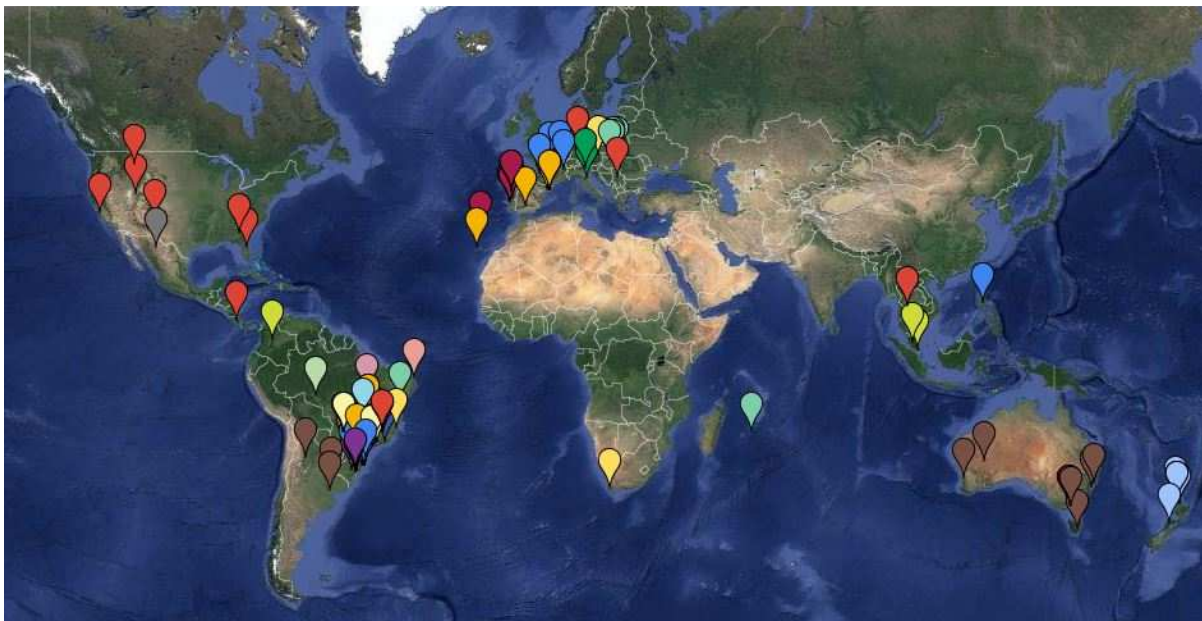
Figura 1 - Mapa Mundial das Equipes de Drift Trike