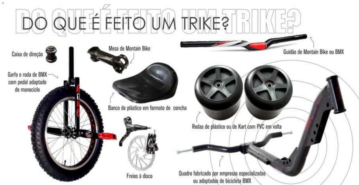
Figura 3 - Peças utilizadas para a construção de um Trike