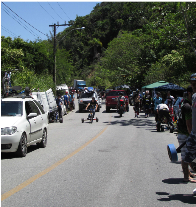
Figura 8 - Pilotos chegando para o GP de Bombinhas 2014