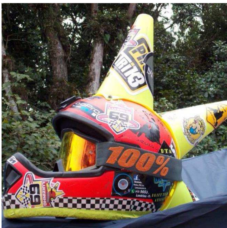
Figura 144 - Capacete com modificações (piloto de Curitiba/PR)

Depois que ocorreu a padronização das dimensões do trike e dos equipamentos que podem ou não serem utilizados durante os campeonatos, os pilotos passaram a utilizar de outras formas para se diferenciar dos demais. O capacete, por exemplo, não é mais só um equipamento de proteção, é o meio para realizar a identificação do piloto, ou se tornar a marca registrada dele, o mesmo acontece com os óculos de proteção ou os macacões. Há ainda os que utilizam de uma cor específica para os seus equipamentos e roupas, como o piloto que sempre usa as cores verde, branco e preto no dia dos campeonatos e seus equipamentos são pintados destas cores. A seguir há algumas imagens que mostram as modificações realizadas nos capacetes para ilustrar que ele não é mais visto, somente, como equipamento de proteção, mas também, como marca registrada do piloto.