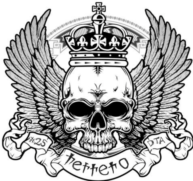
Figura 111 - Símbolo de identificação de um dos pilotos de Apucarana/PR

Porém, ao observar os aspectos destes símbolos dentro das equipes percebi que pode ocorrer uma ressignificação em alguns elementos. Assim como há símbolos que remetem ao Trike , as equipes ou pilotos desenvolveram símbolos para se identificarem, como alguns exemplificados a seguir. E nesta elaboração utilizaram-se de elementos que remetem a sentidos compartilhados por todos com algo que ligue a imagem da equipe ou da pessoa. No caso do uso da caveira, o trike e algum símbolo que remeta a uma característica particular – a bebida que sempre leva nos encontros, características da sua ascendência, caricatura do seu nome ou apelido, por exemplo.