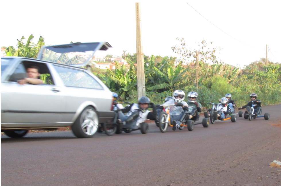
Figura 5 - “Reboque” dos trikes para o início do percurso (Apucarana/PR)

Normalmente, o Trike é praticado em grupo e as funções desempenhadas por cada um são decididas no momento em que se reúnem e podem variar no decorrer de um mesmo encontro. Há uma pessoa que fica responsável por cuidar do “apoio”, ela ficará com o carro que fará o reboque dos trikes do final da ladeira para o topo novamente. Geralmente, este carro desce na frente dos trikeiros durante o percurso a fim de observar a movimentação de carros e pedestres para liberar a decida. Na parte traseira do veículo é amarrada uma corda, na qual as pessoas se seguram para realizar a subida ou “reboque”, retornando ao ponto de início, como representado pela fotografia a seguir.