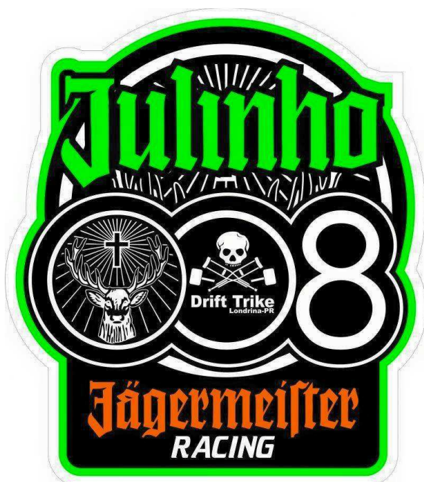
Figura 12 - Símbolo de um piloto da equipe de Londrina/PR