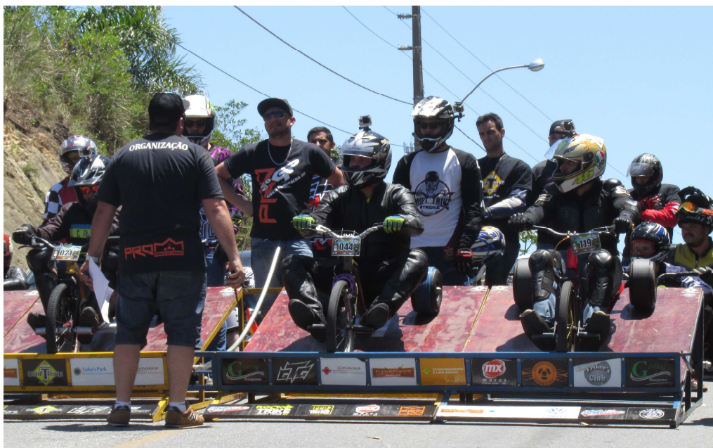
Figura 166 - Rampa de largada no modelo da NDT para campeonatos nacionais

Algumas equipes, na intenção de diferenciar-se das demais personalizam suas rampas, ou mesmo, fabricam rampas com medidas superiores, como o caso da rampa ilustrada na imagem que segue. E isso afeta diretamente no espaço utilizado pela equipe na cidade, seja na questão do tráfego ou na imagem que as pessoas constroem sobre a ladeira diferenciando-a das demais. No caso da rampa usada como exemplo, há a vinculação da ladeira desta equipe com a “rampa monstro”, como chamam.