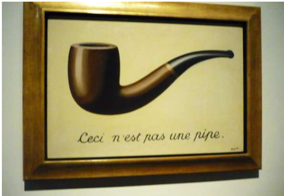
Quadro intitulado: Ceci n'est pas une pipe (1928-9) – Óleo sobre Tela – 63,5 x 93,98 cm. Autor: René Magritte.