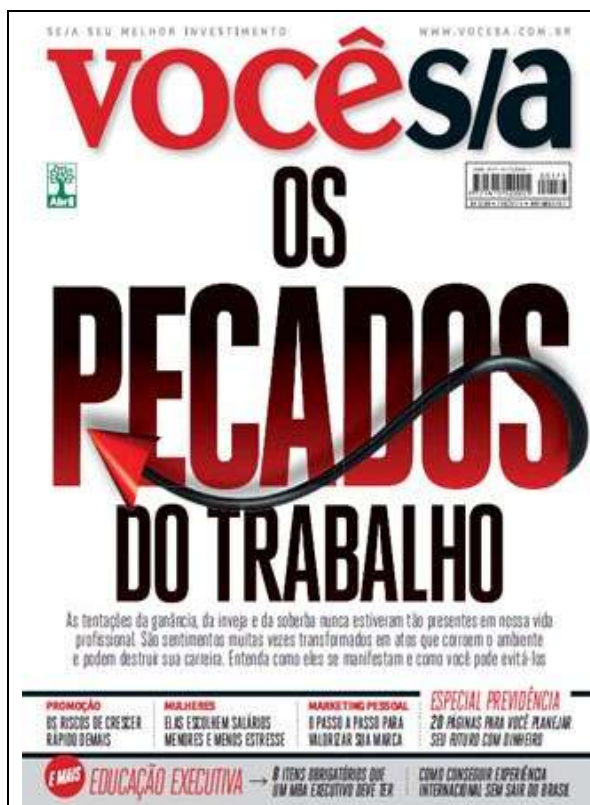
Figura 10 – “Os pecados do trabalho. As tentações da ganância, da inveja e da soberba nunca estiveram tão presentes em nossa vida profissional. São sentimentos muitas vezes transformados em atos que corroem o ambiente e podem destruir a sua carreira. Entenda como eles se manifestam e como você pode evitá-las” - Edição de nº 173, novembro de 2012.

comum “uma imagem vale mais do que mil palavras”, o uso de imagens como narrativas mostra-se como mais uma prática discursiva eficiente usada pelo enunciador midiático. O executivo é representado como um líder que controla a si e aos outros e que sempre sorri: sempre está numa postura de liderança nos moldes neoliberais do que é ser um líder – um líder que governa a si e aos outros, mas que sabe se relacionar bem e sabe dialogar.