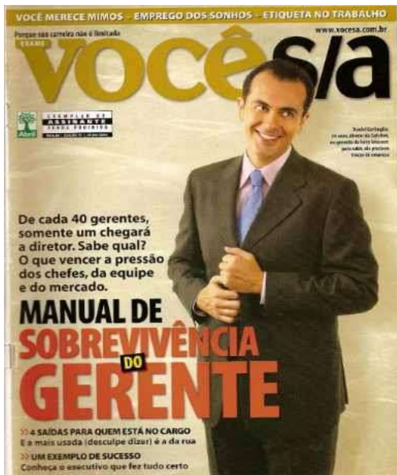
Figura 2 - "Manual de Sobrevivência do Gerente. De cada 40 gerentes, somente um chegará a diretor. Sabe qual? O que vencer a pressão dos chefes da equipe e do mercado" (edição de nº 97, junho de 2006).

Na capa da revista Você S/A , edição de nº 97, junho de 2006, a conjugação da imagem fotográfica, à direita do enunciado, enquadra um homem de meia idade, vestido de terno e gravata, mostrando estar satisfeito com sua profissão. Para esse efeito de sentido concorre a funcionalidade do sorriso, do olhar e a posição das mãos, que caracteriza um homem que sobreviveu às pressões do trabalho e obteve sucesso. Esse efeito de sentido projeta-se sobre o enunciado verbal à esquerda da imagem, no qual se lê: "Manual de Sobrevivência do Gerente. De cada 40 gerentes, somente um chegará a diretor. Sabe qual? O que vencer a pressão dos chefes da equipe e do mercado". A imagem é de um homem que, supostamente, seguiu os passos do manual estampado na capa e venceu. Esse enunciado remete, em um primeiro momento, aos manuais de sobrevivência na selva. Esses manuais geralmente são escritos por alguém com certa experiência em situações adversas encontradas na mata fechada. O efeito produzido é que esse manual orienta as