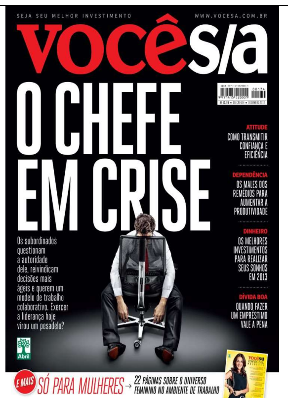
Figura 11 – “O chefe em crise. Os subordinados questionam a autoridade dele, reivindicam decisões mais ágeis e querem um modelo de trabalho colaborativo. Exercer a liderança hoje virou um pesadelo?” - Edição de nº 174, dezembro de 2012.

Nessas capas (Edições 173 e 174) da Você S/A também se presentifica, parafrasticamente, a ideia de um executivo comprometido, interessado, obstinado e realizador. Na capa da edição de nº 173, o enunciado “Os pecados do trabalho” está vazado na manchete com letras garrafais: a palavra “pecado” está grafada em vermelho e em caixa alta. Também há um símbolo de uma cauda demoníaca saindo