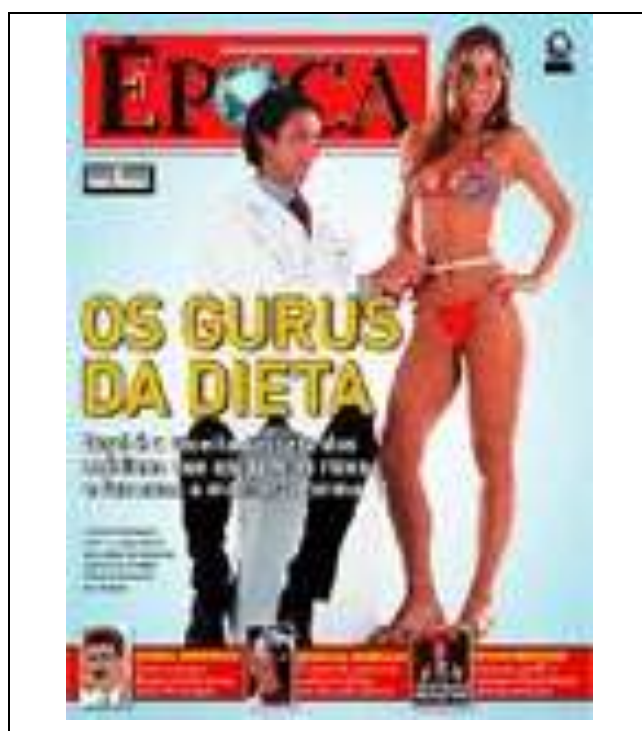
Figura 5 – “Os gurus da dieta. Qual é a receita secreta dos médicos que ajudam os ricos e famosos a manter a forma”

Com essa nova visão sobre a aparência, o corpo torna-se um objeto de experiências em detrimento da forma perfeita. Navarro traz um exemplo muito interessante a respeito dos discursos que emergem do campo da medicina e da estética materializados na capa da revista Época (edição nº. 361, 18 de abril de 2005), em que há uma modelo de 40 anos de biquíni exibindo seu corpo em forma e ao seu lado há um médico com uma fita métrica medindo a cintura da modelo. Ao lado dessa imagem há o seguinte enunciado “Os gurus da dieta. Qual é a receita secreta dos médicos que ajudam os ricos e famosos a manter a forma”.