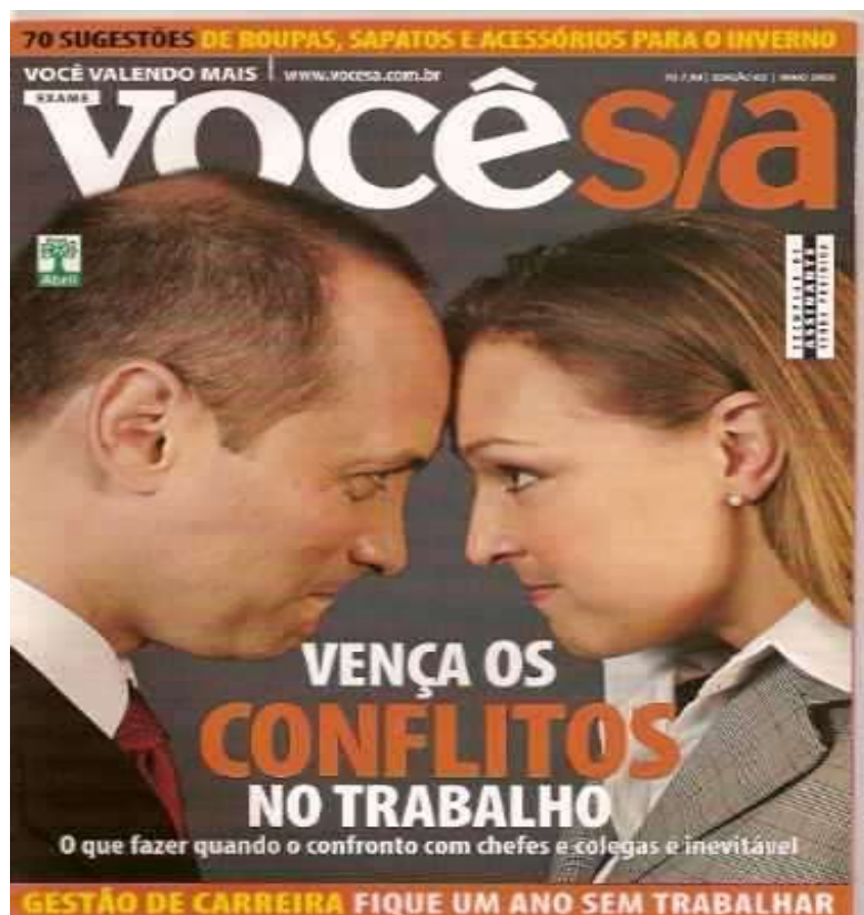
Figura 3 - “Vença os conflitos no trabalho. O que fazer quando o confronto com chefes e colegas é inevitável” (edição de nº. 86, maio de 2006).

O enunciado “Vença os conflitos no trabalho. O que fazer quando o confronto com chefes e colegas é inevitável” ( Você S/A , edição de nº. 86, maio de 2006) retoma o embate entre homens e mulheres no trabalho. Gráficamente, o destaque dado à palavra “conflitos”, que se encontra em tipos maiores e na cor laranja, não somente realça essa palavra-chave, como reforça a ideia da competição. Nesse enunciado, há um enquadramento da memória coletiva que materializa o embate entre os sexos. Esse efeito de sentido é reforçado pelo enunciado imagético, que enquadra, num mesmo plano, um homem vestido de terno e gravata e uma mulher com roupa típica de executiva. Estando um de frente para o outro, fitam-se com olhar de agressividade e expressão facial de rivalidade. A circulação de enunciados como esses funciona como dispositivo identitário, para o qual a competitividade surge como um importante elemento organizador dos efeitos de poder sobre o executivo.