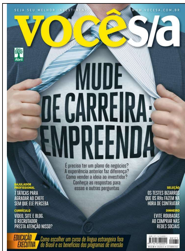
Figura 8 - “Mude de carreira: empreenda” - Edição nº 171 – setembro de 2012