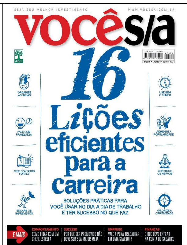
Figura 9 - “16 lições eficientes para a carreira – soluções práticas para você usar no dia a dia de trabalho e ter sucesso no que faz” - Edição nº 172 – outubro de 2012

As mesmas observações – no tocante à estrutura linguístico-discursiva do gênero textual “texto instrucional” (MARCUSHI, 2002) - também se aplicam às matérias de capa das edições 171 e 172, de setembro e outubro de 2012 e a muitas outras não citadas, que funcionam parafrasticamente em relação a estas. Na edição nº 171 há, no plano do texto imagético, uma nítida intertextualidade com a figura do super homem, em que o executivo é convidado – por meio do enunciado verbal: “Mude de carreira: empreenda” – a assumir a sua suposta verdadeira identidade de empreendedor de si mesmo. Nesta capa, bem como nas outras, reitera-se o efeito de sentido de um sujeito que controla o seu corpo, ou seja, que exerce os seus cuidados de si (que é capaz de governar a si e que conhece a si mesmo) e que, portanto, pode governar os outros.