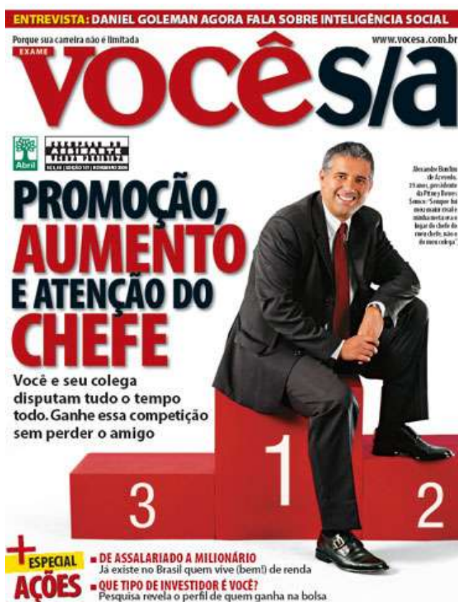
Figura 4 – “Promoção, aumento, e atenção do chefe. Você e seu colega disputam tudo o tempo todo. Ganhe essa competição sem perder o amigo”

colega disputam tudo o tempo todo. Ganhe essa competição sem perder o amigo” (Você S/A, edição de nº.101, novembro de 2006).