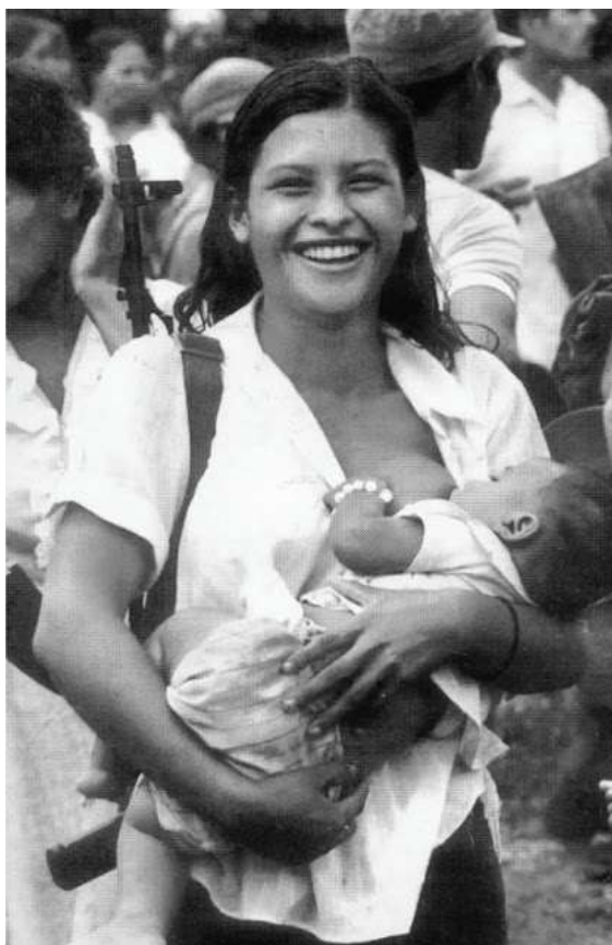
Figura 19. Miliciana de Waswalito, Matagalpa, 1982.

Fotografia de Orlando Valenzuela, 1982. Acesso em 10/08/2017. Disponível em: http://blogdelviejotopo.blogspot.com.br/2015/07/mujeres-fusiles-y-resistencias-5-la.html .