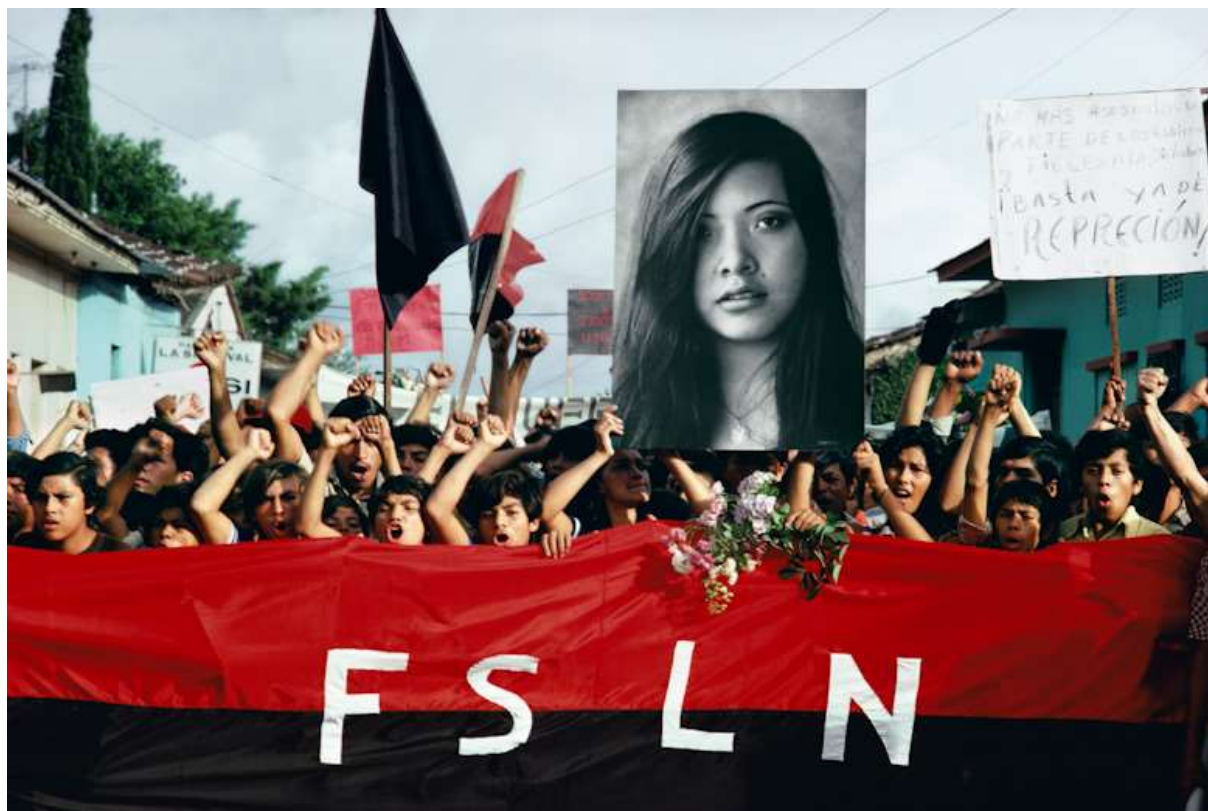
Figura 3. Procissão de funeral para um líder estudantil assassinado. Os manifestantes carregam a fotografia de Arlen Siu, guerrilheira morta nas montanhas 3 anos antes. Jinotepe, 1978.