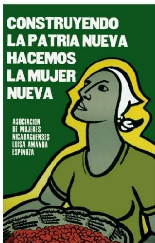
Figura 16. Cartaz da AMNLAE.