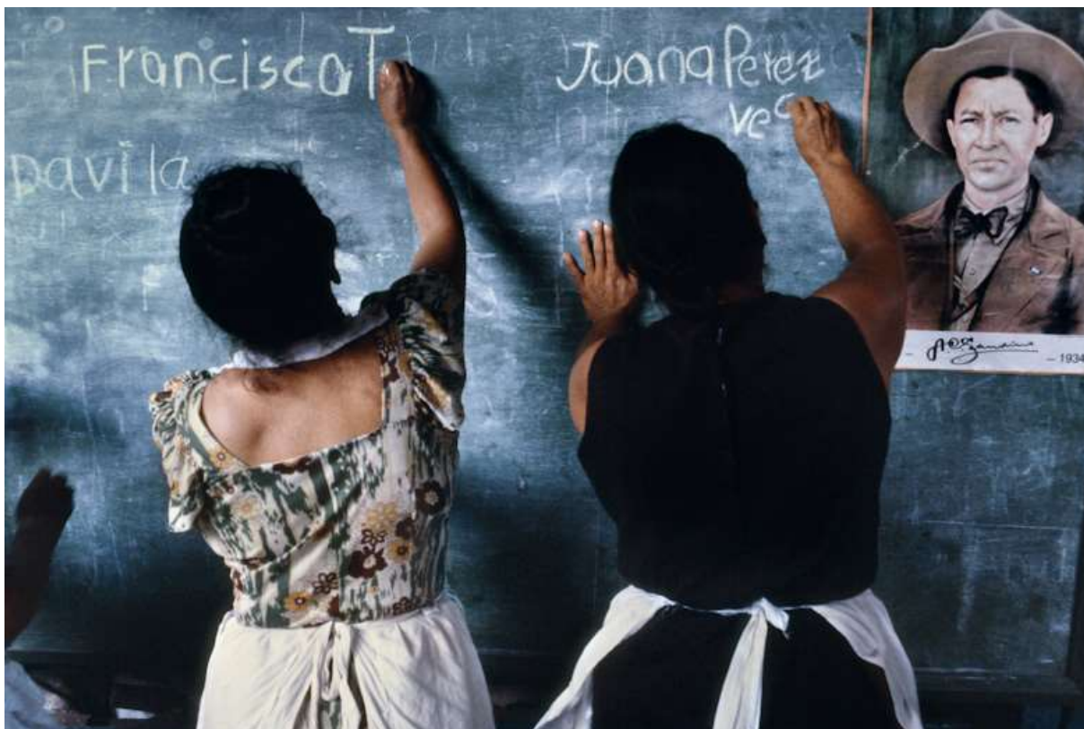
Figura 6. Campanha de Alfabetização ensinando literatura para mulheres no mercado de Huembes em Manágua, 1979.