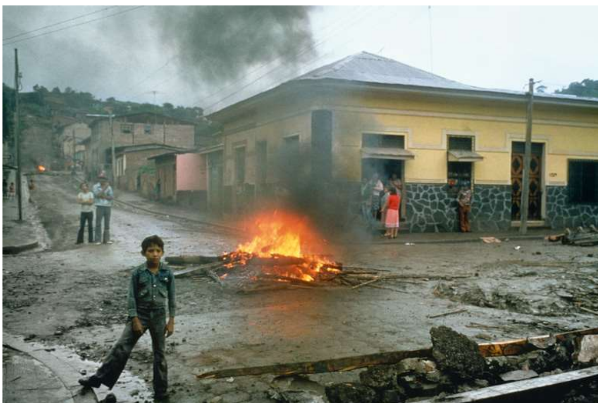
Figura 2. Matagalpa, 1978.