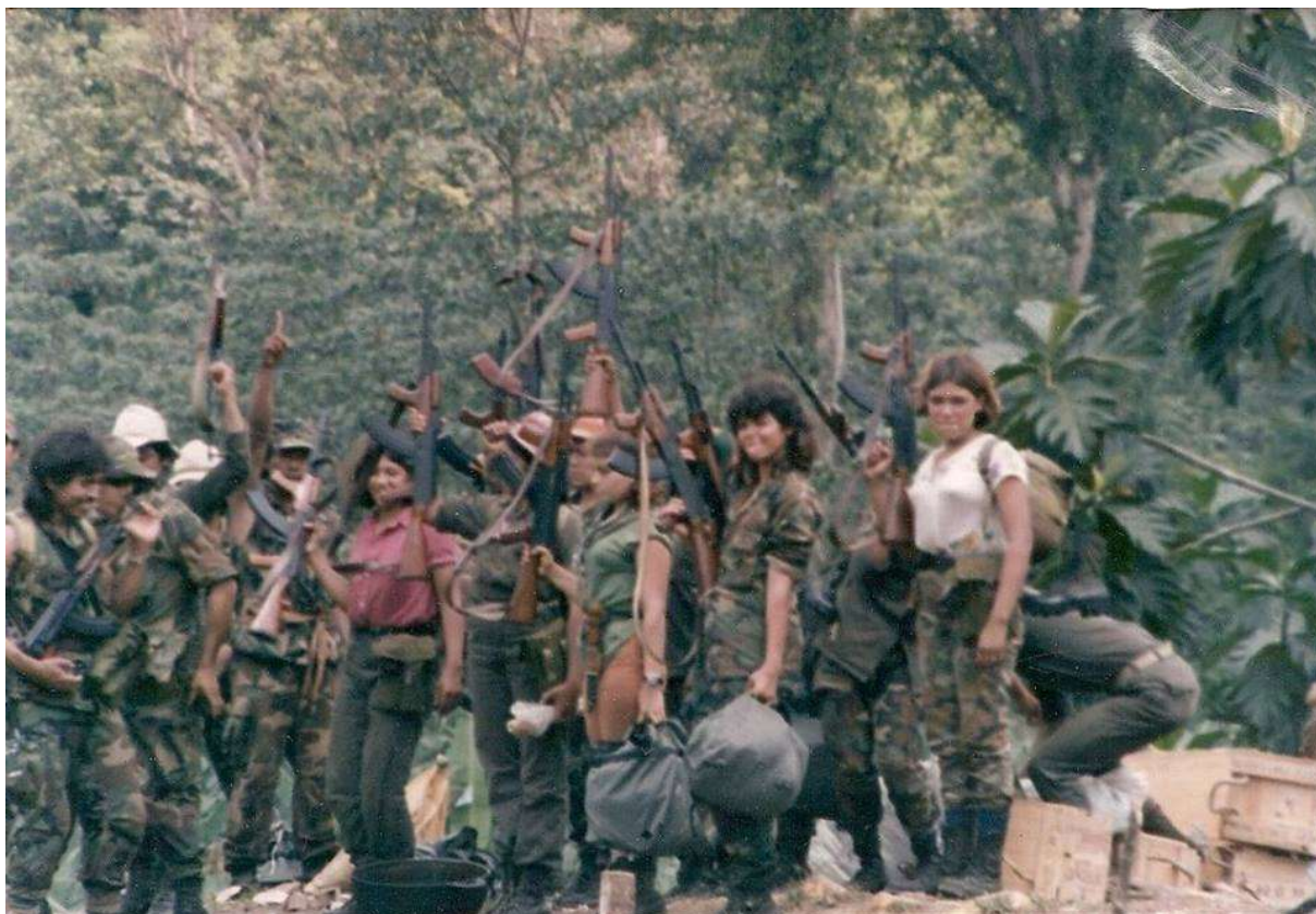
Figura 8. Guerrilheiras e guerrilheiros sandinistas em Nueva Guinea, Nicarágua, por volta de 1987.

Origem da foto: desconhecida. Fonte: facebook.com . Acesso em 15/06/2017.