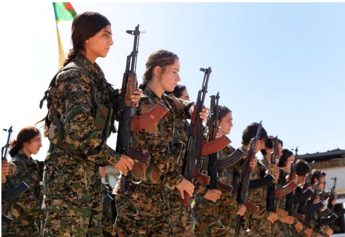
Figura 24. Mulheres combatentes curdas, outubro de 2016.