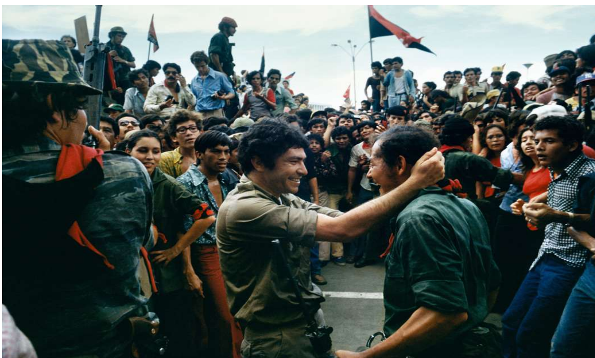
Figura 4. Plaza de la Revolución, Managua, Nicaragua 1979.

Foto de Susan Meiselas. Acesso em 10/06/2017. Disponível em: