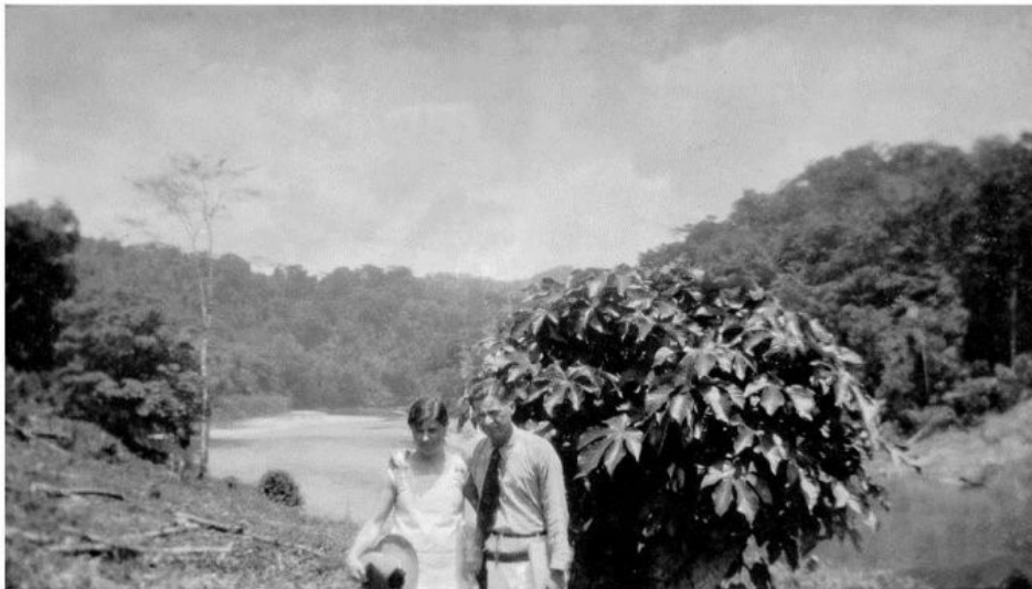
Augusto Sandino y Blanca Aráuz en el Río Coco, 1932. Foto: CHM-EN.

Foto: CHM-EM, 1932. Acervo de Mónica Baltodano. Disponível em: https://memoriasdelaluchasandinista.org . Acesso em 10/08/2017.