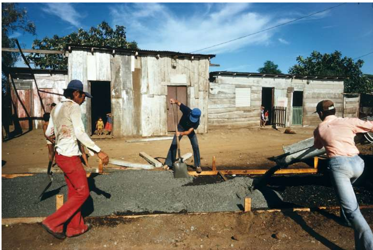
Figura 5. Construção de calçada em Manágua, 1979.