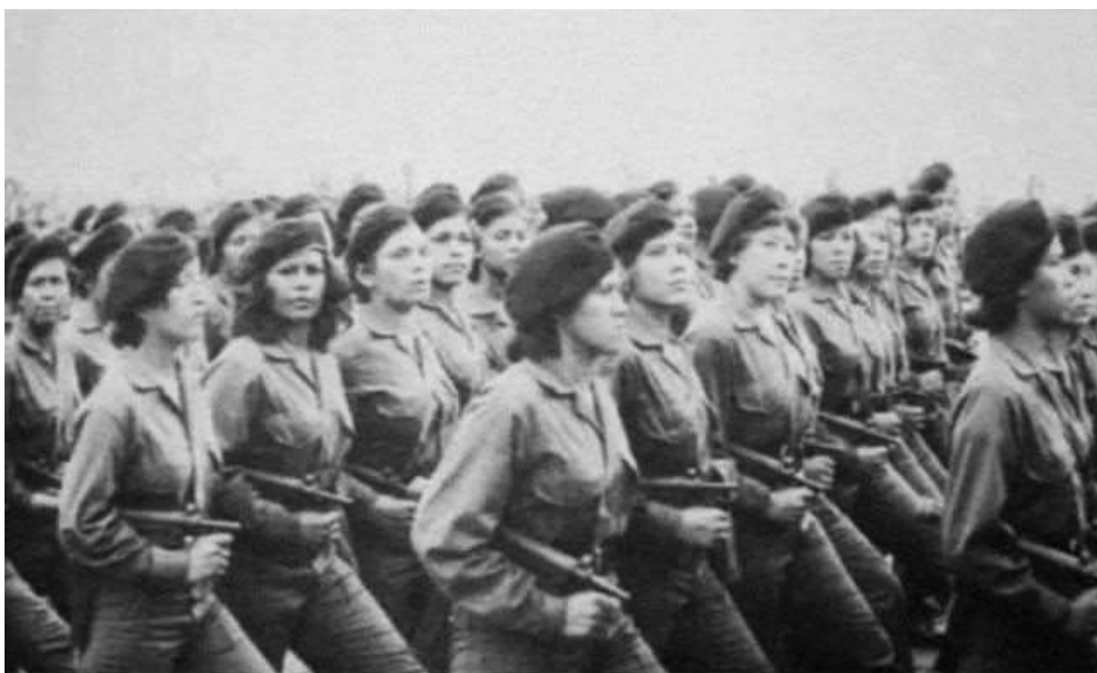
Desfile del Ejército Popular Sandinista en julio de 1980. ARCHIVO MÓNICA BALTODANO

Disponível em: https://memoriasdelaluchasandinista.org . Acesso em 10/08/2017.