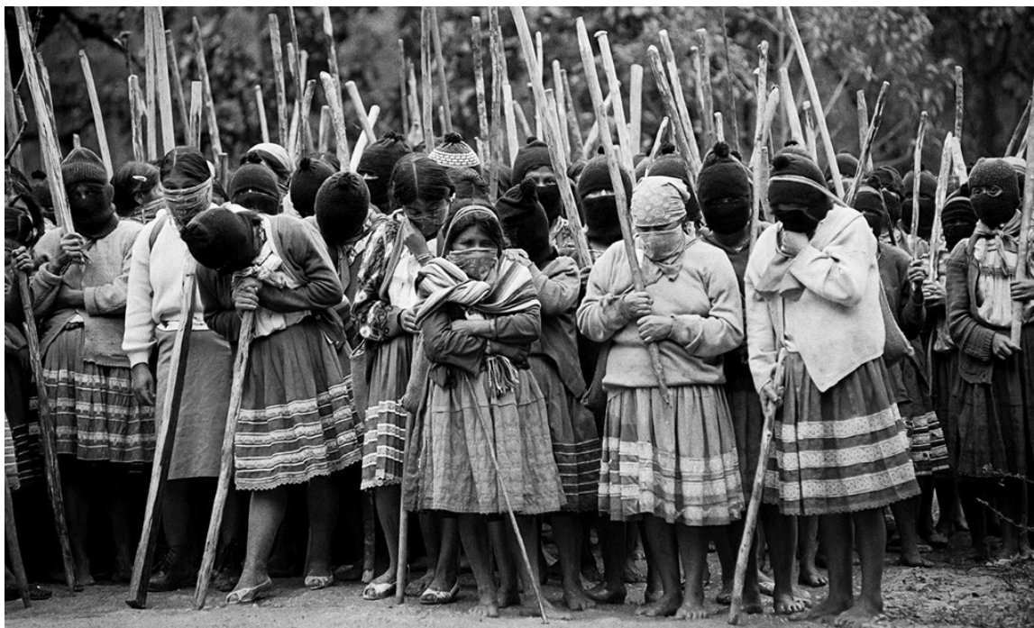
Figura 22. Mujeres zapatistas, 1º de enero de 1994.

Fonte: https://lasiniestra.com/la-rebelion-zapatista-y-el-festejo-de-su-no-cumpleanos/ . Acesso em 22/03/2018.