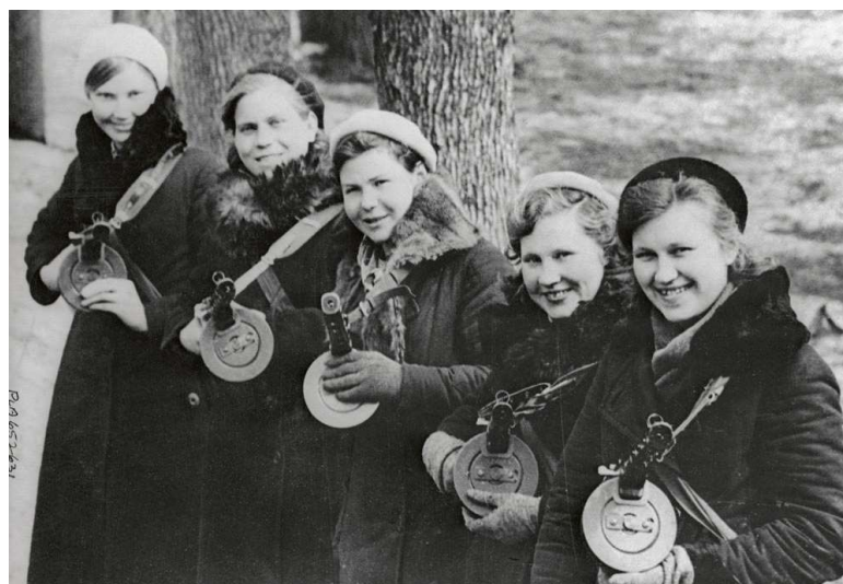
Figura 26. Mulheres soviéticas passam a ter o direito de prestar serviço militar, 1939.