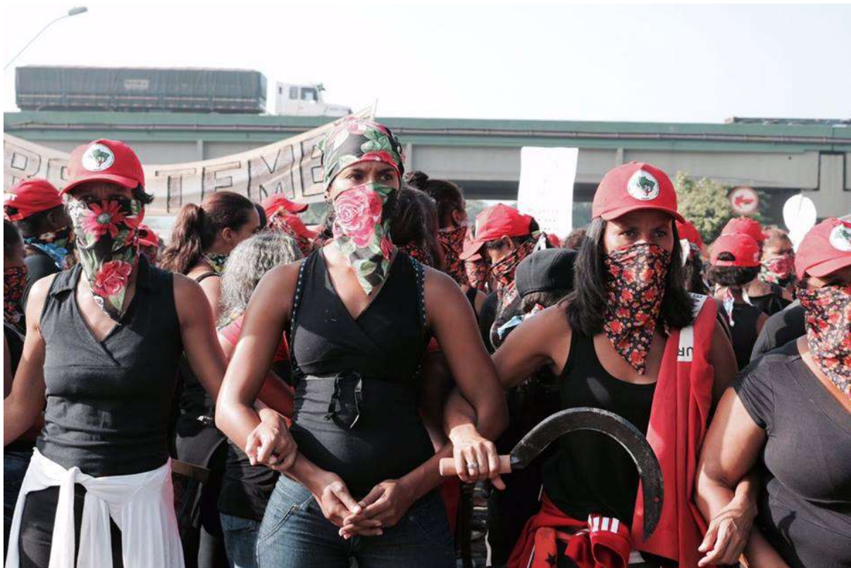
Figura 23. Mulheres do MST protestam contra a empresa Vale, março de 2017.