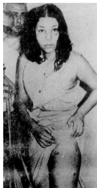
Figura 14. 54