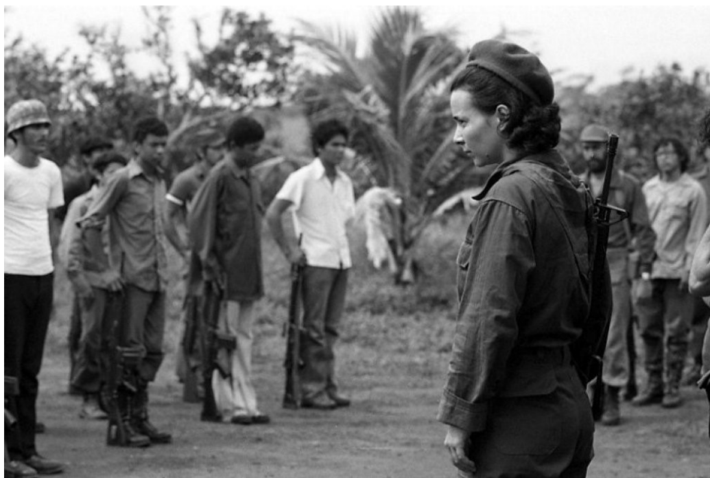
Figura 15. Nora Astorga, 1978.

Fotografia de Pedro Meyer, tomada em 1978. Acesso em 10/08/2017. Disponível em: http://blogdelviejotopo.blogspot.com.br/2015/07/mujeres-fusiles-y-resistencias-5-la.html .