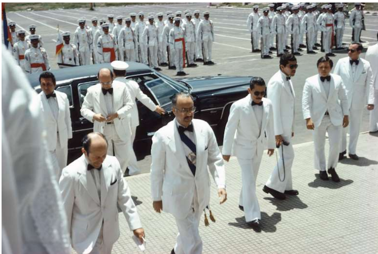
Figura 1. Presidente Anastasio Somoza Debayle, abrindo nova sessão do Congresso Nacional. Manágua, 1978.