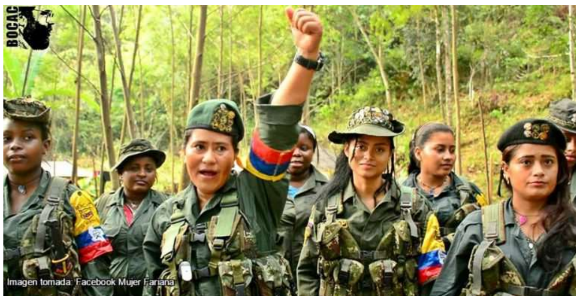
Figura 21. Mujeres Guerrilleras del Bloque Occidental Alfonso Cano.