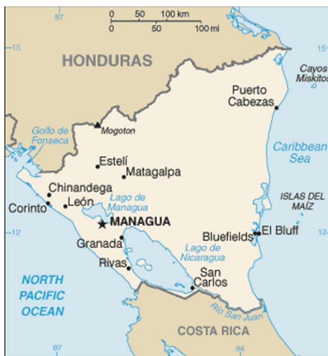
Mapa 2. Nicarágua.

Fonte CIA. World Factbook. Disponível em: https://www.cia.gov/library/publications/resources/the-world-factbook/graphics/maps/nu-map.gif . Acesso em 09/06/2017.