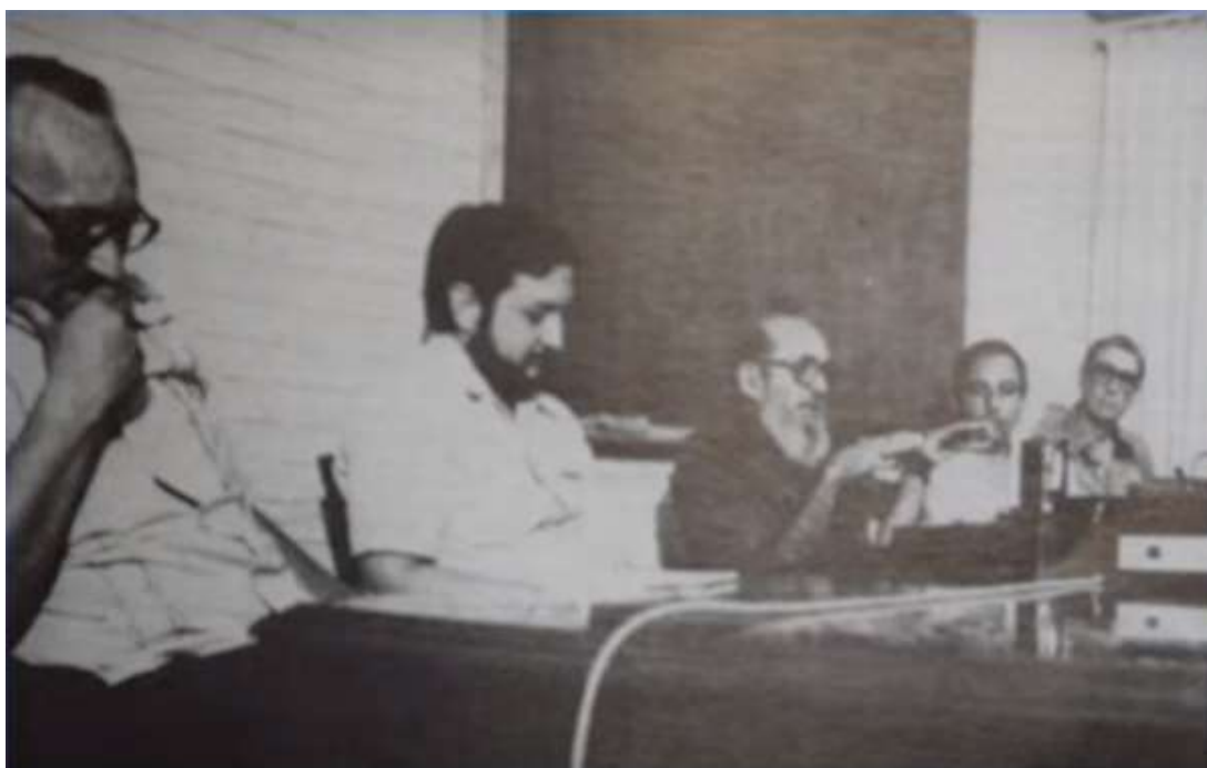
Figura 7. Paulo Freire (ao centro) e Ernesto Cardenal (último à direita), na Nicarágua.