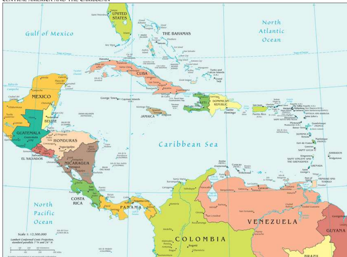
CENTRAL AMERICA AND THE CARIBBEAN