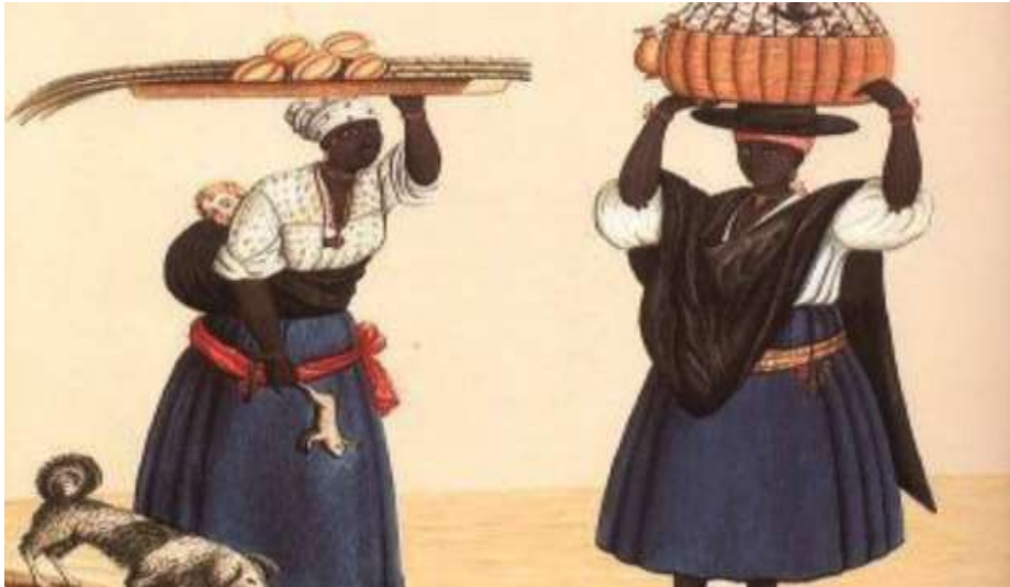
Figura 29 - Negras de Tabuleiro, de Carlos Julião (Iconografia Biblioteca Nacional).

As negras de tabuleiro sem dúvida tiveram um papel de grande relevância nas Gerais do século XVIII. Tamanho era sua influência que chegaram a ser consideradas como um perigo na região das Minas, principalmente próximo ao leito dos rios, onde era feita a extração do ouro.