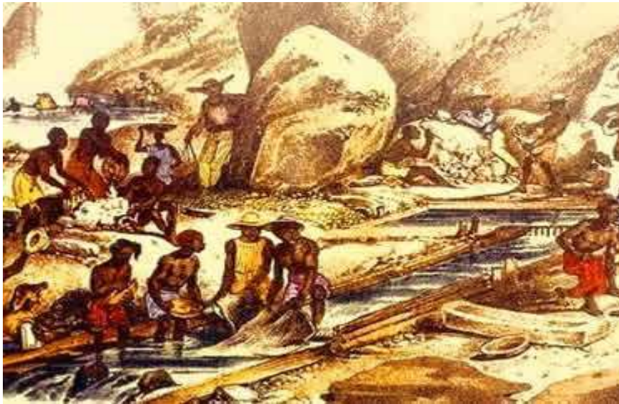
Figura 19 - Processo de extração do ouro nas Gerais do século XVIII. Rugendas 1835

influência da cultura africana, pois, lutando contra a escravidão, eram os negros a grande maioria da população.