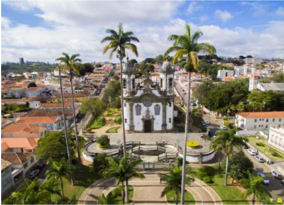
Figura 28 - Igreja de São Francisco de Assis, São João Del Rei – MG.

Carmo, de 1732; Igreja de Nossa Senhora das Mercês, cuja construção é de 1751; Igreja de São Gonçalo, que foi construída em substituição à primitiva capela em 1772. Além disso há monumentos, museu, pontes e chafarizes que marcam o eterno século XVIII das Gerais.