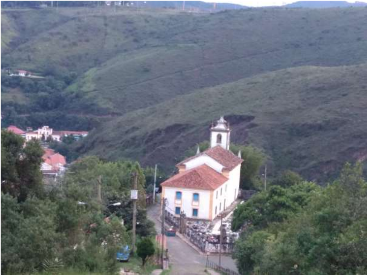
Figura 21 - Vista da Igreja de São José, Ouro Preto-MG 05/01/19