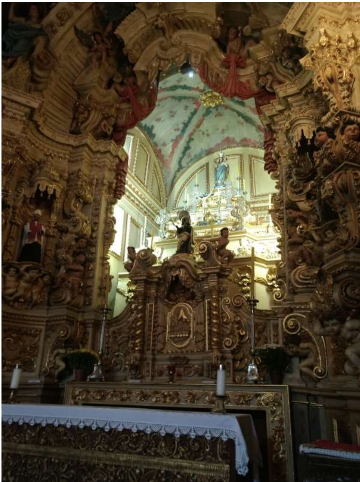
Figura 40 - Imagem do altar da Igreja de Santa Efigênia, Ouro Preto-MG, 08/01/19