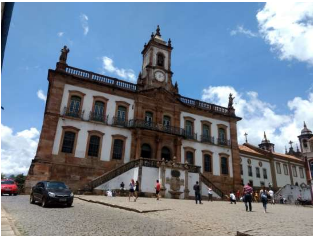
Figura 37 - Antiga Câmara e Cadeia de Vila Rica, atual Museu da Inconfidência, Ouro Preto-MG 06/01/19