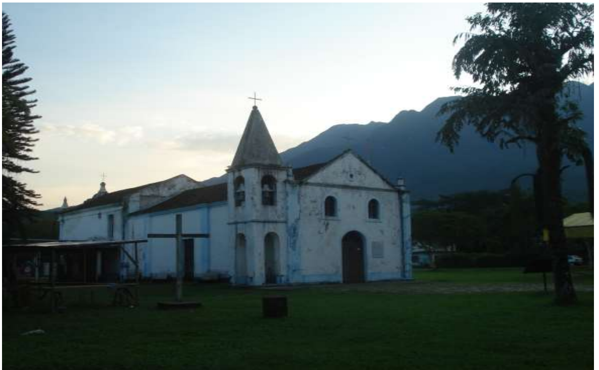
Figura 18 - Igreja de São Sebastião de Porto de Cima/Paraná, com fachada do século XIX e ao fundo as torres do século XVIII.