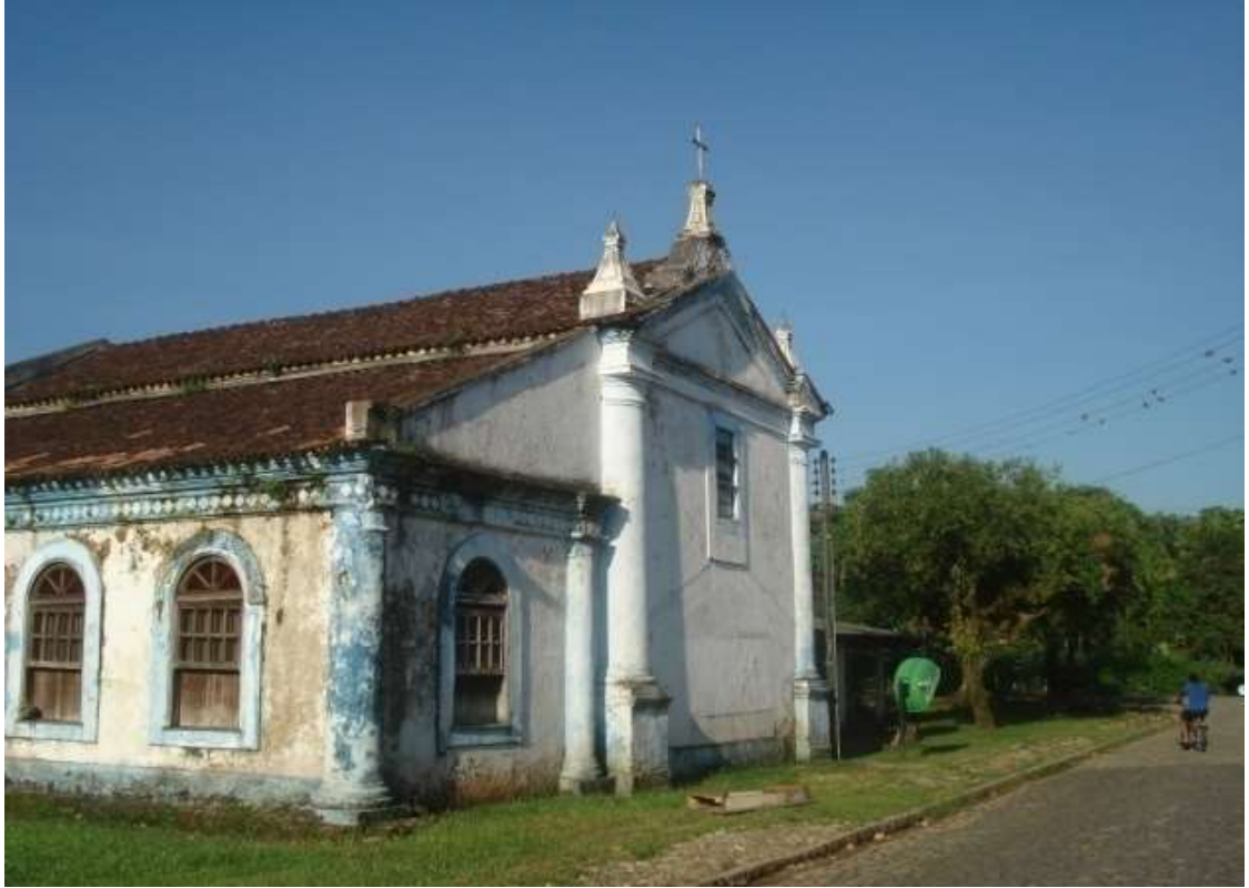
Figura 17 - Fachada Secundária da Igreja de São Sebastião de Porto de Cima/Paraná, construída no século XVIII.