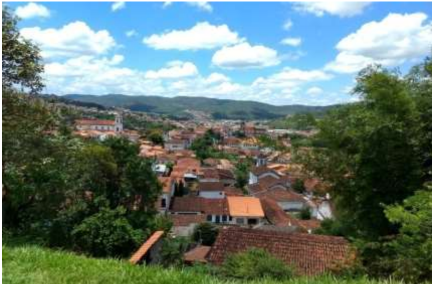
Figura 27 - Vista de Mariana – MG, Janeiro de 2019

Fazer história é uma prática. Sob este ângulo podemos passar para uma perspectiva mais pragmática, considerando os caminhos que se abrem sem se prender mais à situação epistemológica que, até aqui, foi desvendado pela sociologia da historiografia (CERTEAU, 1982, p.78).