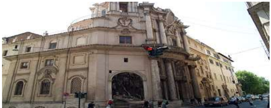
Figura 8 - FRANCESCO BORROMINI. Fachada de S. Carlo alleQuattroFontane, Roma 1165-67.

Diz Janson (2001) sobre Borromini que: “Gênio reservado e emocionalmente instável, acabou por suicidar-se. O contraste entre os dois temperamentos ressaltaria das próprias obras, mesmo sem o depoimento de testemunhas contemporâneas” (p.731).