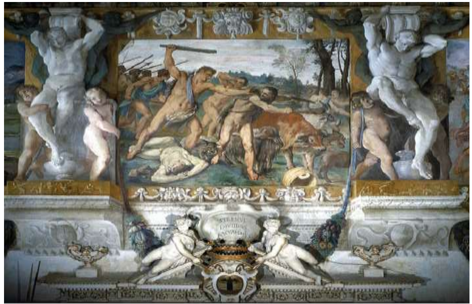
Figura 4 - CARRACI. Remo ladriarmenti. PalazzoMagnani, Bolonha

Esse famoso afresco retrata a fundação de Roma (1590/1592), faz parte de um ciclo de autoria de Carracci, Ludovico e Agostino e fica na sala de honra de Lorenzo Magnani.