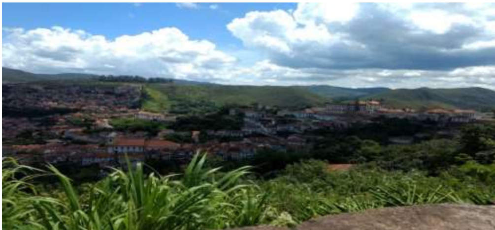
Figura 24 - Vista de Ouro Preto – MG, Janeiro de 2019.

É importante mencionar também que a cidade é um pólo difusor de incentivo às artes, o que acaba por impulsionar o trabalho de artistas da região, além de ser um importante centro de formação universitário onde se encontra a Universidade Federal de Ouro Preto (UFOP) a qual “foi criada no dia 21 de agosto de 1969, com a junção das centenárias e tradicionais Escola de Farmácia e Escola de Minas. Ao longo dos anos cresceu e ampliou seu espaço físico, ganhando novos cursos, professores e colaboradores” ( https://ufop.br ).