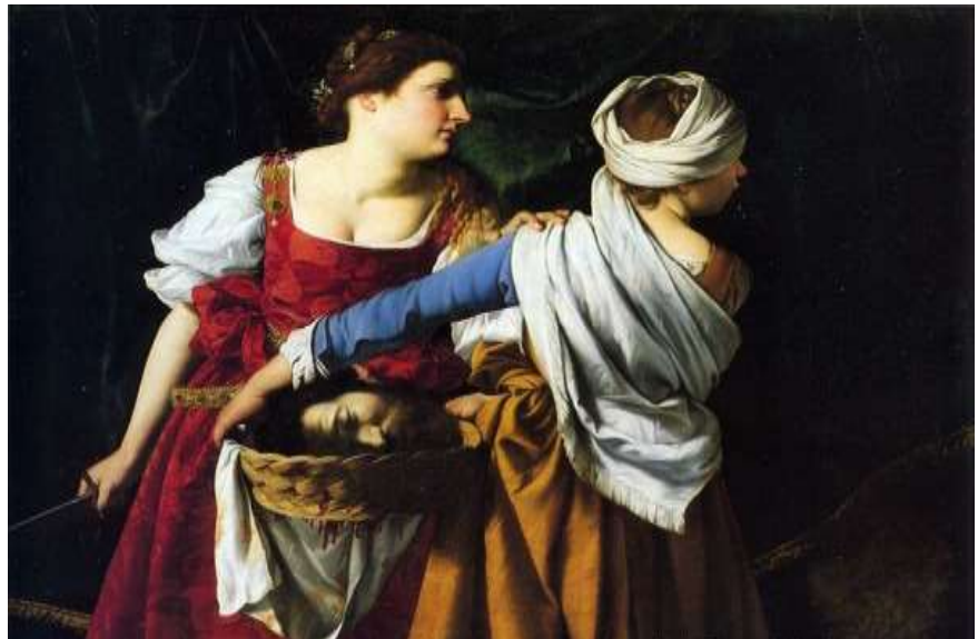
Figura 3 -ARTEMÍSIA GENTILESCHI. Judite e sua Criada. Palácio Pitti, Florença.

Os acontecimentos que marcaram a vida de Artemísia não impediram que se tornasse uma das maiores representantes do barroco em sua época, fazendo dela uma artista que carregou uma singularidade excêntrica, mostrando a expressão desse movimento.