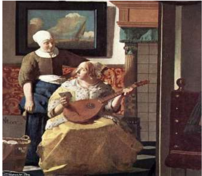
Figura 14 - VERMEER. A Carta. Rijksmuseum, Amsterdam.

A obra foi planejada como sendo um tríptico, onde a cena doméstica ocupa a parte central. Através da porta aberta, vê-se uma sala, onde se encontram uma senhora e sua criada, próximas a uma lareira. Segundo alguns historiadores de arte trata-se de parte do interior da própria casa do artista.