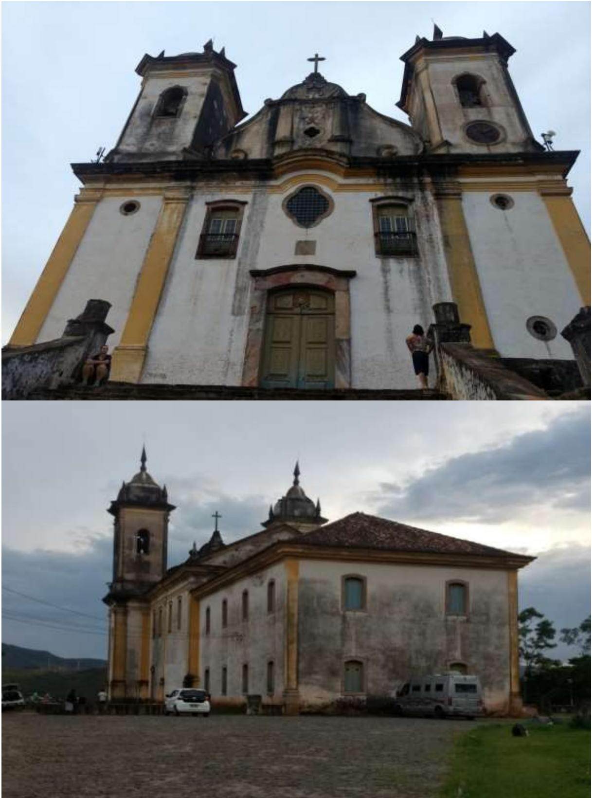
Figura 23 - Frente e lateral da Igreja de São Francisco de Paula, Ouro Preto-MG 05/01/19

Percorrer Ouro Preto é transcender a memória viva das tramas e das narrativas do barroco mineiro, o qual se encontra vivo nas terras das Gerais, através da preservação de um