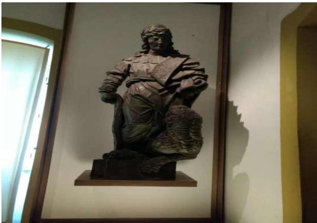
Figura 34 - Réplica em gesso da imagem do Profeta Daniel, Museu da Inconfidência. A escultura original feita por Aleijadinho está em Congonhas no Santuário Bom Jesus de Matosinhos.

A obra desse santuário da segunda metade do século XVIII é composta pela Igreja do Bom Jesus de Congonhas, as doze esculturas de Aleijadinho e seis capelas que retratam os passos da Paixão de Cristo. Dentro das capelas encontramos aproximadamente sessenta esculturas em madeira, retratando os momentos finais de Cristo. Toda essa essência deixada por Antônio Francisco Lisboa em Congonhas mostra toda a subjetividade e vigor desse mestre que elevou o barroco mineiro entre as artes mais nobres encontradas no Brasil e no mundo.