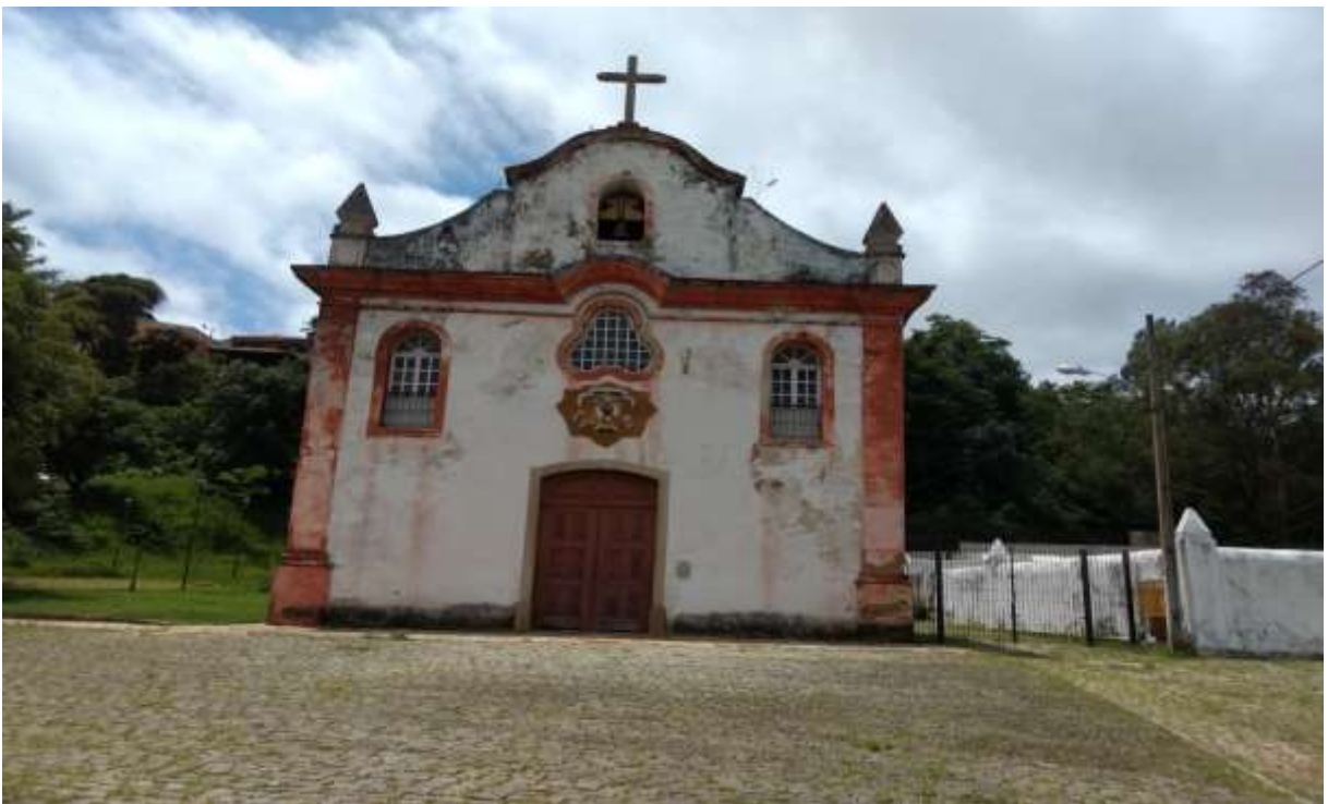
Figura 22 - Frente da Igreja de Nossa Senhora das Dores, Ouro Preto-MG, 08/01/19