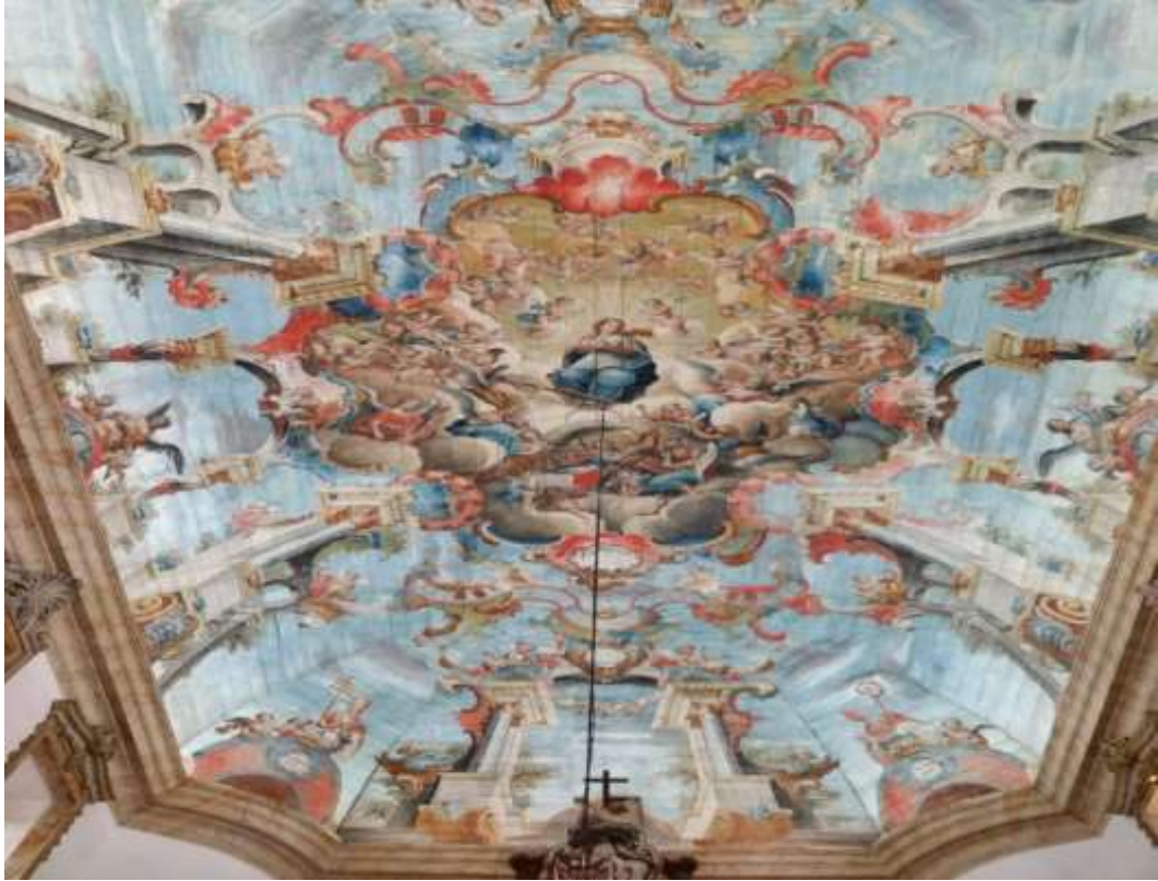
Figura 36 - Pintura no teto da Igreja de São Francisco de Assis, atribuída a Mestre Ataíde, Ouro Preto-MG

Não há dúvidas de que a presença da religiosidade marcou o estilo barroco no Brasil, principalmente em Minas, onde os fiéis não mediam esforços para mostrar todo seu ímpeto religioso. Para Boschi (1988) “a sua vaidade e o exibicionismo de sua generosidade faziam dele um contribuinte permanente das receitas financeiras das irmandades” (p.36).