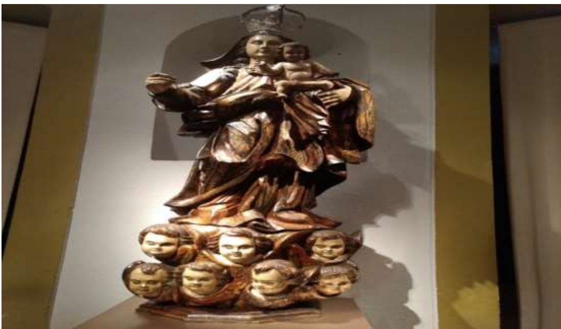
Figura 38 - Nossa Senhora do Rosário-madeira de cedro policromada e dourada. Procedência Paracatu-MG. Museu da Inconfidência