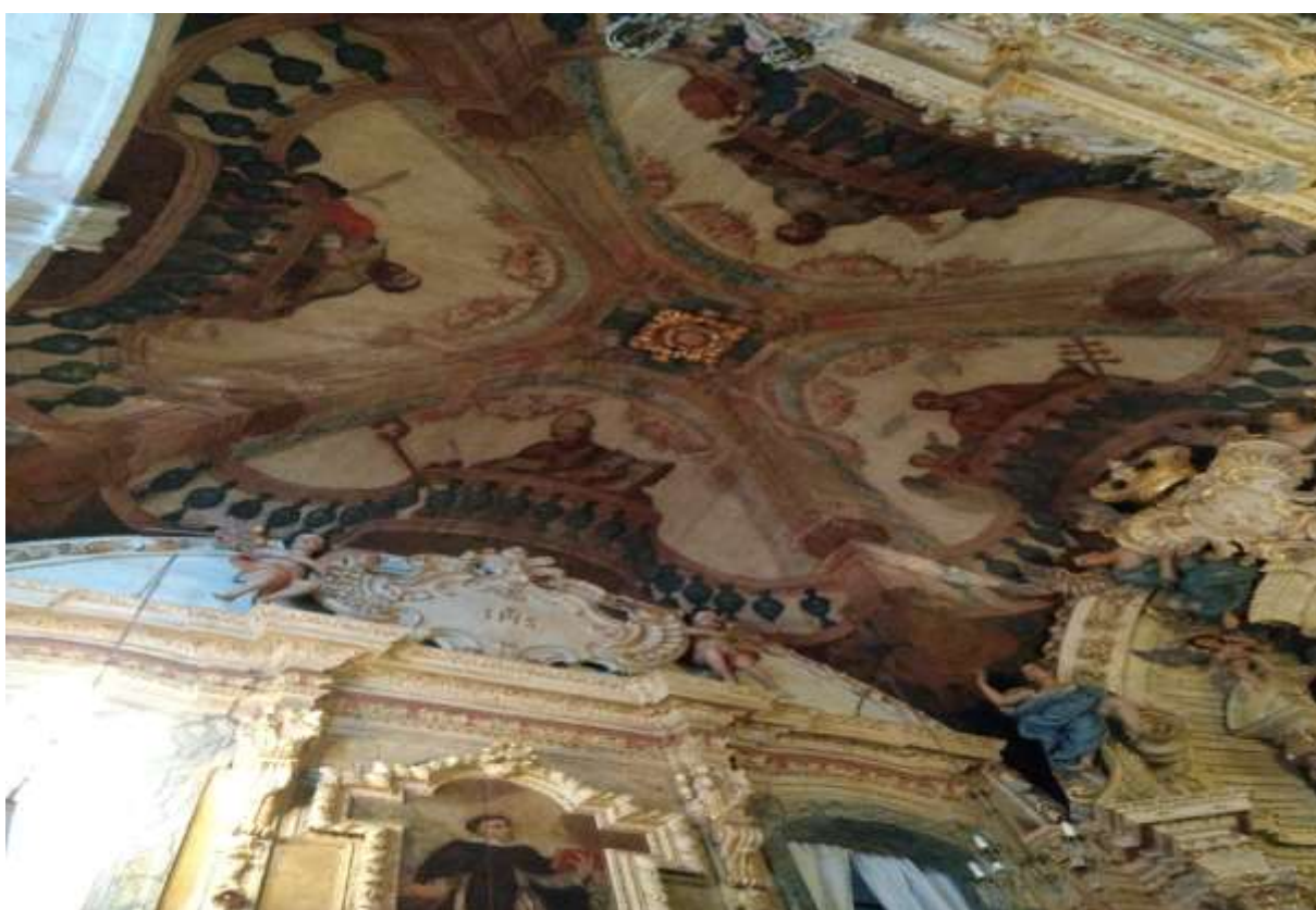
Figura 41 - Pinturas no teto da Igreja de Santa Efigênia, Ouro Preto-MG, 08/01/19