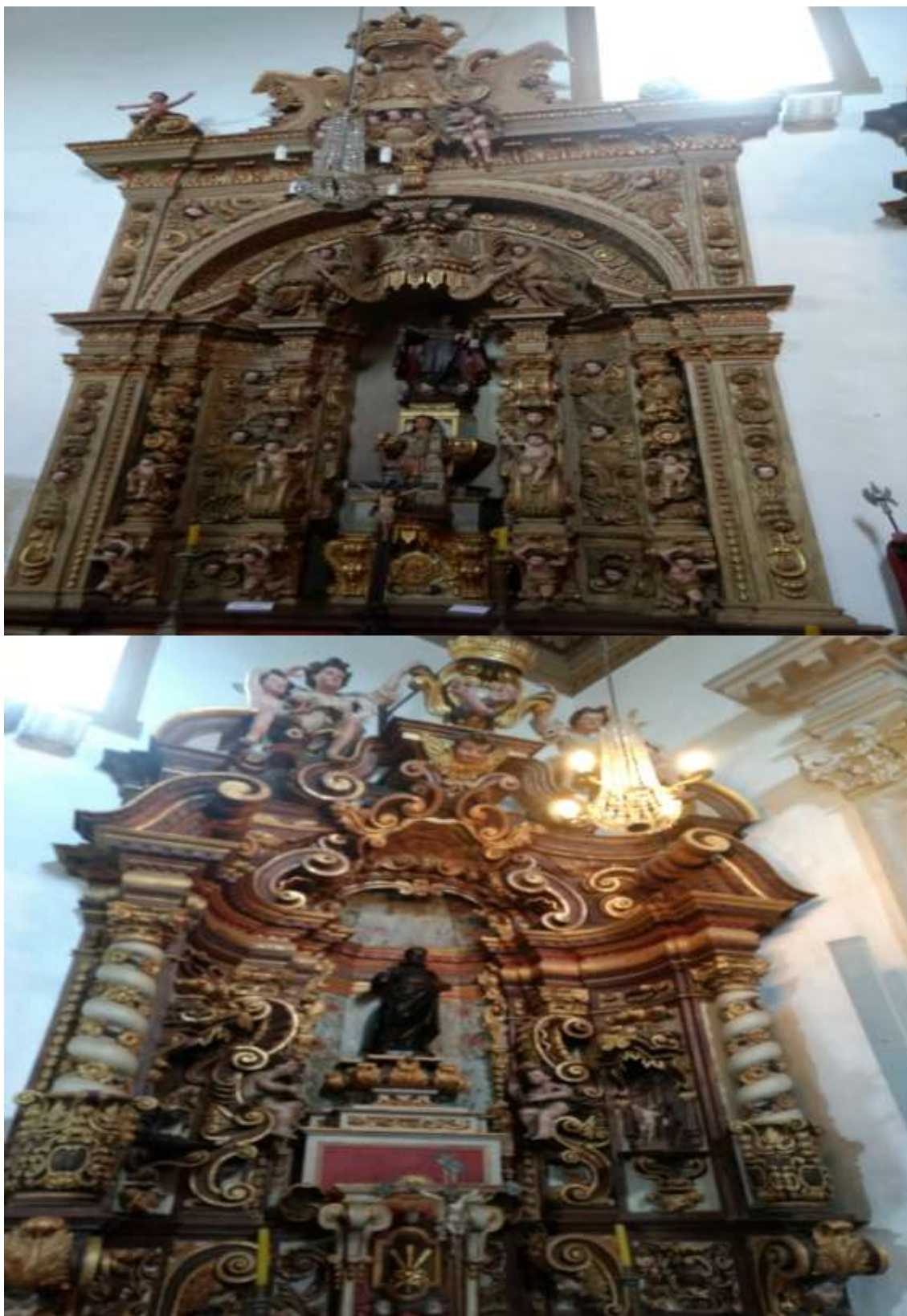
Figura 42 - Imagens laterais da Igreja de Santa Efigênia, Ouro Preto-MG, 08/01/19