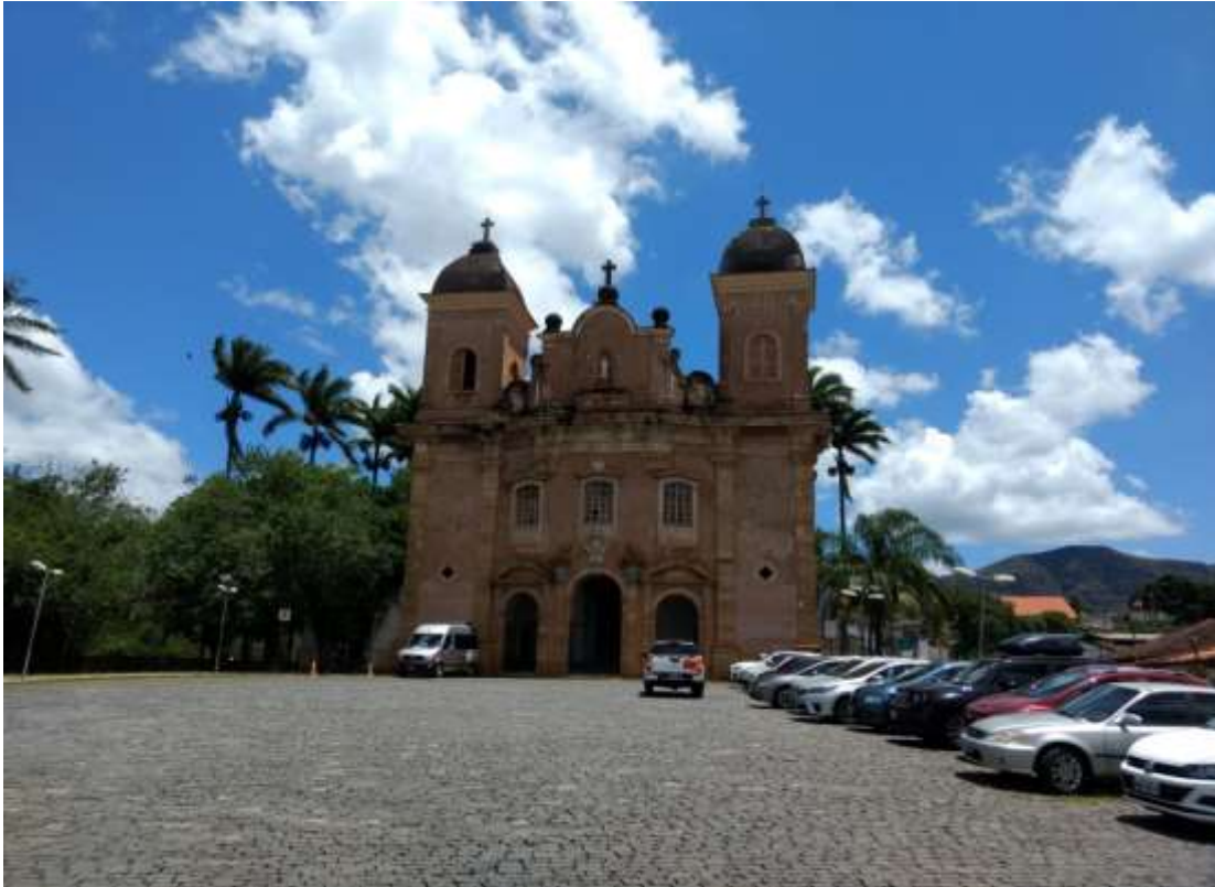
Figura 25 - Frente da Igreja de São Pedro dos Clérigos, Mariana-MG, 07/01/19