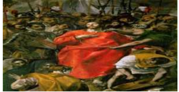
Figura 10 - EL GRECO. O Espólio (1579). Catedral de Toledo, Espanha.

Sua obra Oespólio , também chamada Desnudamento de Cristo , El Greco adorna a sacristia da Catedral de Toledo, chamando a atenção pela mancha vermelha na túnica de Jesus. A obra apresenta elementos reais e abstratos, onde percebemos uma grande quantidade de pessoas em torno de Jesus, tendo algumas apenas a cabeça visível.