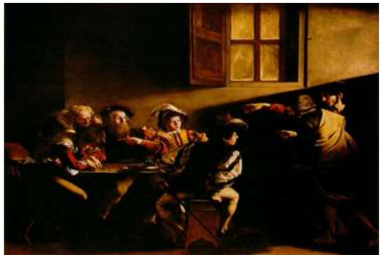
Figura 1 - CARAVAGGIO. A Vocação de S. Matheus, Capela Contarelli S. Luigi dei Francesi, Roma