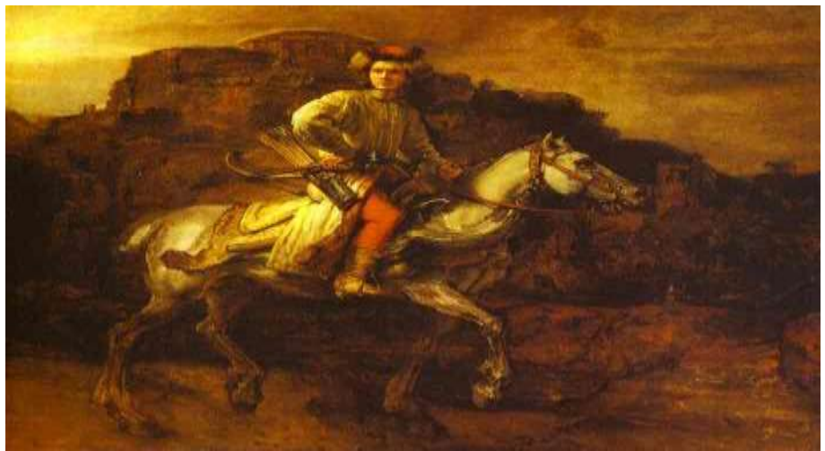
Figura 13 - REMBRANDT. O Cavaleiro Polaco (1655). Nova Iorque (Copyright).

Rembrandt (1606-1669): Foi um pintor holandês, considerado um dos maiores nomes da arte europeia. Como afirma Janson (2001) “o maior gênio da arte holandesa, sofreu também no começo de sua carreira influência indireta de Caravaggio” (p.752). Ele ainda diz que nos seus últimos anos, o autor adaptou muitas vezes, a seu modo, composições e ideias pictóricas do Renascimento setentrional, como acontece na obra "O Cavaleiro Polaco".