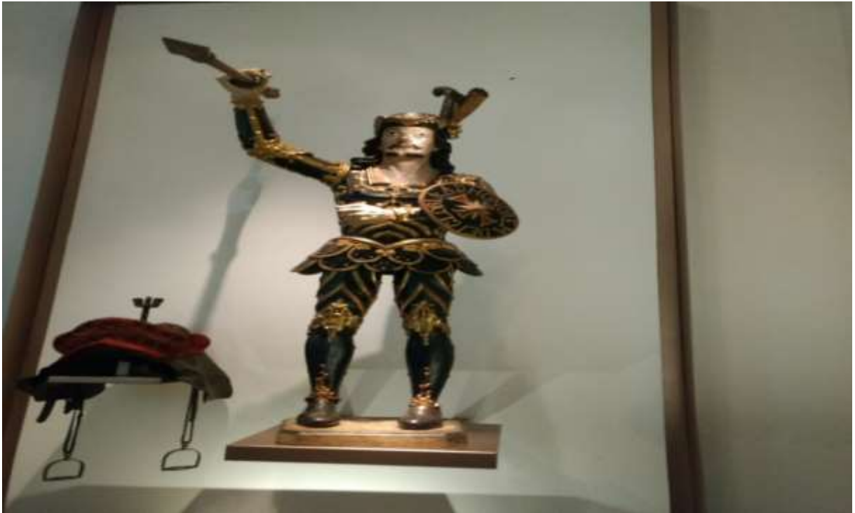
Figura 35 - Imagem de São Jorge, atribuída a Aleijadinho. Museu da Inconfidência

Outro grande nome representante do barroco mineiro na pintura, e que aliás tem seus trabalhos de policromia realizados no Santuário do Bom Jesus de Matosinhos, é Manuel da Costa Ataíde, o mestre Ataíde, nascido em Mariana em 1762. Como a grande maioria dos pintores da época do barroco mineiro, ele seguia os cânones da Igreja Católica. Sua arte compreendeu principalmente o douramento e encarnação de imagens, trabalhos em talha, pintura sobre painéis, pinturas de forros de igreja, empregando sempre cores vivas. Suas obras encontram-se espalhadas por diversas cidades mineiras, tendo sido mestre Ataíde um grande colaborador do Aleijadinho.