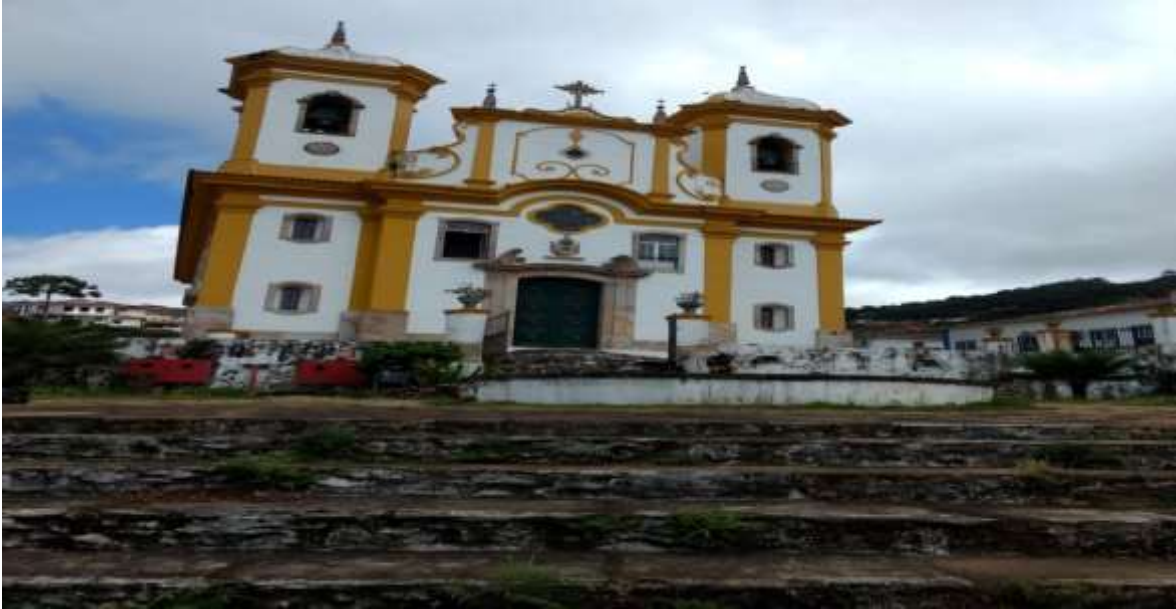
Figura 30 - Imagem da Igreja de Nossa Senhora da Conceição, Ouro Preto-MG, 08/01/19

altares laterais; com o tempo muitas irmandades conseguiram recursos para a construção de seus próprios templos.