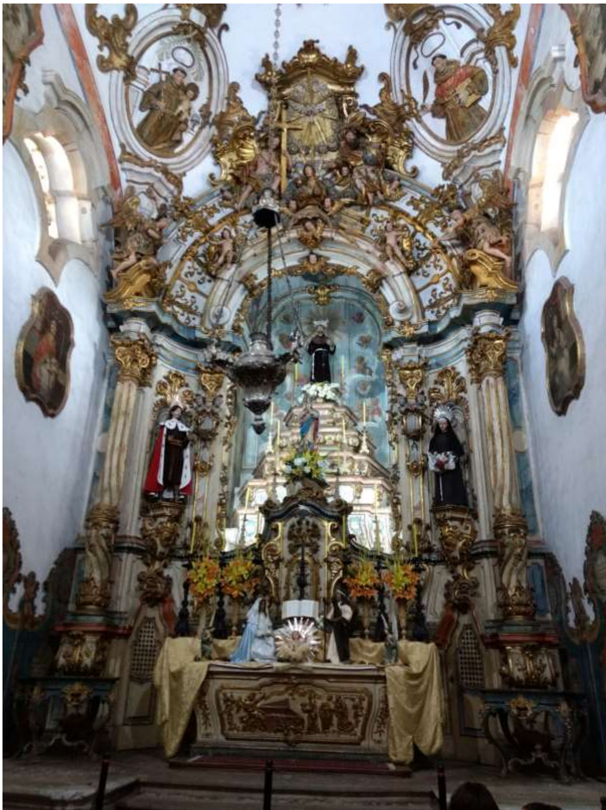
Figura 43 - Imagens do altar da Igreja de São Francisco de Assis, Ouro Preto-MG, 08/01/19