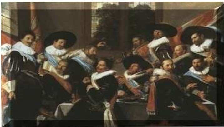
Figura 12 - HALS. Oficiais da Guarda Civil de Santo Adriano em Haarlem (1627). Museu FransHals, Haarlem