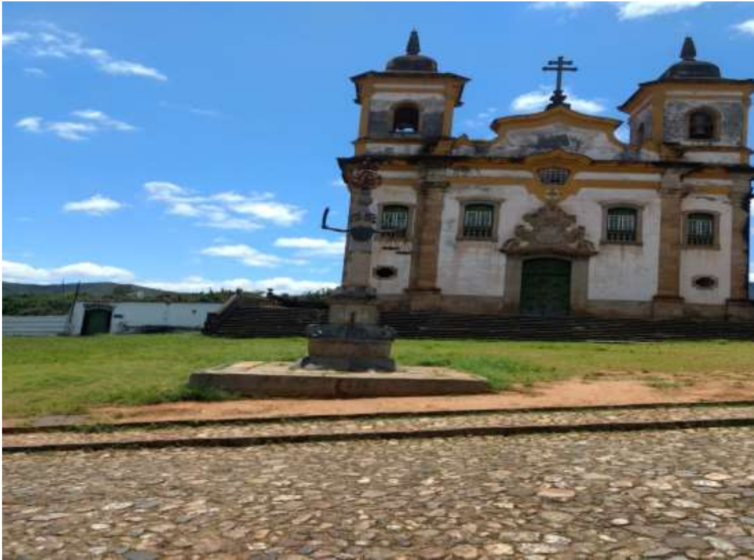
Figura 26 - Frente da Igreja de Nossa Senhora do Carmo, Mariana-MG, 07/01/19

Mariana é uma cidade que também apresenta-se rica aos olhos de quem a visita; suas igrejas e tradições do século XVIII deixam registradas ainda hoje as marcas de um tempo passado. Entre as igrejas de grande destaque podemos citar: Sé Catedral, uma das mais belas igrejas de Minas com sua construção iniciada em 1709 e concluída em 1762; Igreja do Carmo, que teve sua construção iniciada em 1784 e apresenta uma bela portada com enfeites harmoniosos; cita-se ainda a Igreja de São Francisco; a grandiosa São Pedro dos Clérigos; a Igreja das Mercês e a Igreja do Rosário todas com uma arquitetura exuberante, registrando momentos de grande opulência do barroco.