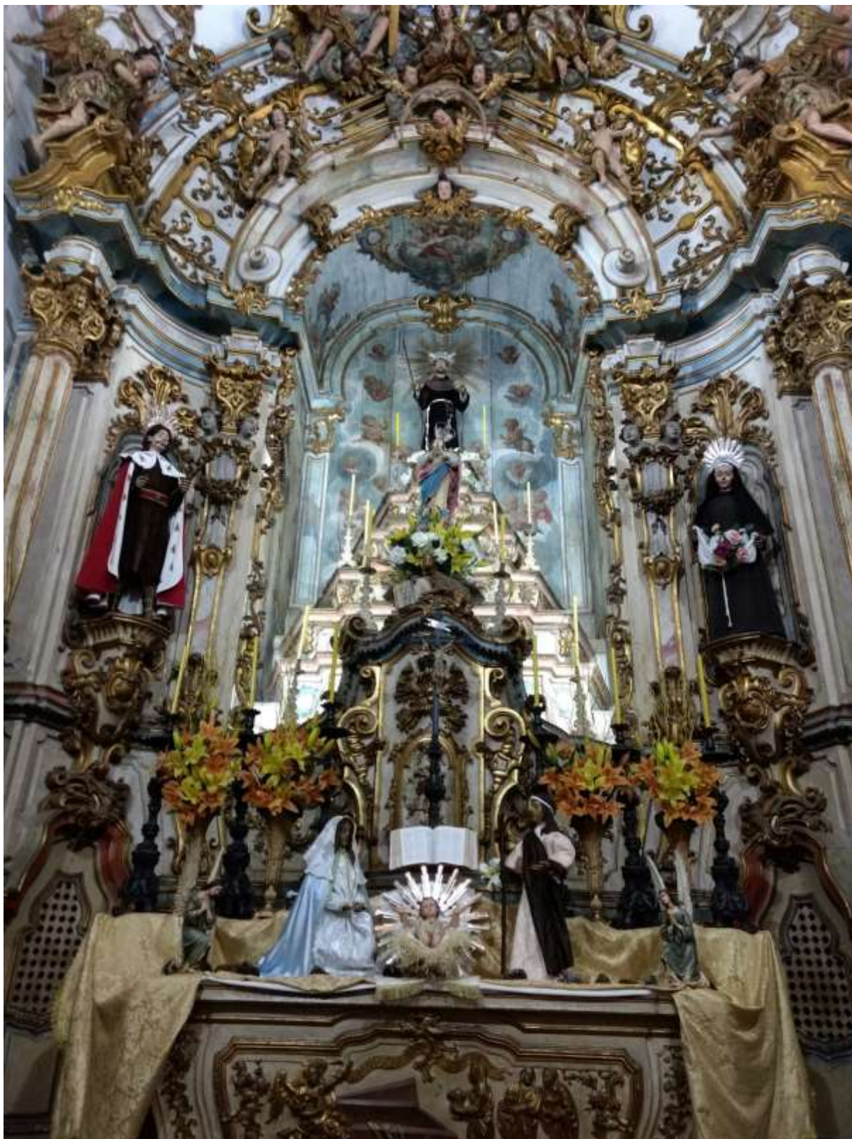
Figura 44 - Altar da Igreja de São Francisco de Assis, Ouro Preto-MG, 08/01/19