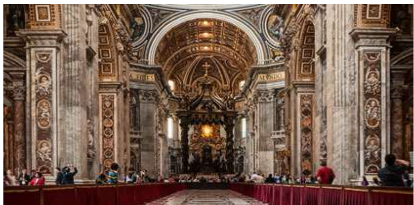
Figura 7 - S.Pedro de Roma: interior (com tabernáculo de Bernini, 1624-33).

Gian Lorenzo Bernini (1598-1680): Nascido em Nápoles, Itália, é considerado o maior arquiteto-escultor do século. É autor das grandes colunas da Praça de São Pedro e do baldaquino, cúpula sustentada por colunas retorcidas que estão sobre o Altar Maior da Basílica de São Pedro no Vaticano, como afirma Janson (2001).