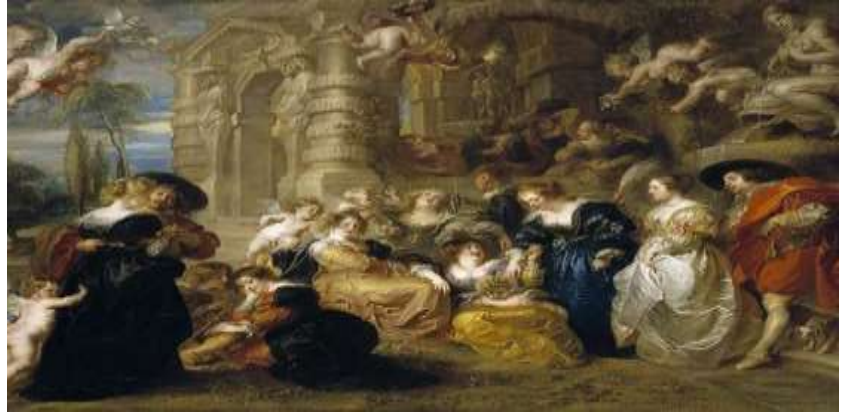
Figura 11 - RUBENS. Jardim do Amor (1632-1634). Museu do Prado, Madri.

Quando a obra foi pintada por Rubens, ele já havia passado dos cinquenta anos, se casara pouco tempo antes, em segundas núpcias, com a bela H elene Fourment. Com esta de encontro ao peito, como se estivessem danando, o artista retrata-se   esquerda da tela, em frente de um portal ao gosto maneirista. Na parte superior, do extremo oposto, aparece, cavalgando um golfinho, uma deusa de cujos seios brota  gua, s mbolo do amor e da fertilidade. Os pequenos cupidos aludem   for a do amor, trazendo flores e pombas, outros s mbolos de V nus.