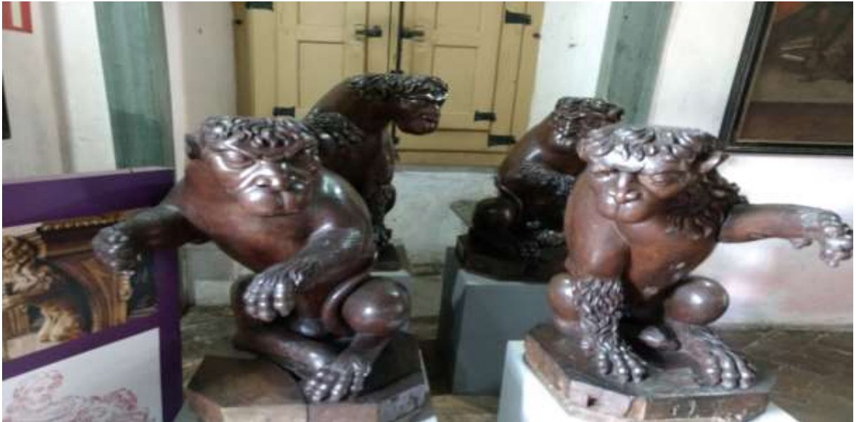
Figura 33 - Leões de Essa, madeira de cedro-Aleijadinho 1787, Igreja de São Francisco de Assis, Ouro Preto - MG

Entre as demais obras de sua autoria espalhadas pela cidade podemos citar: as esculturas da sobreporta e do lavatório da sacristia, da tarja do arco-cruzeiro, os altares laterais de São João Batista e de Nossa Senhora da Piedade na igreja de Nossa Senhora do Carmo; o risco da capela – mor, as imagens de São Pedro Nolasco e São Raimundo Nonato na Igreja das Mercês de Baixo, além de inúmeras outras realizações encontradas em Ouro Preto.