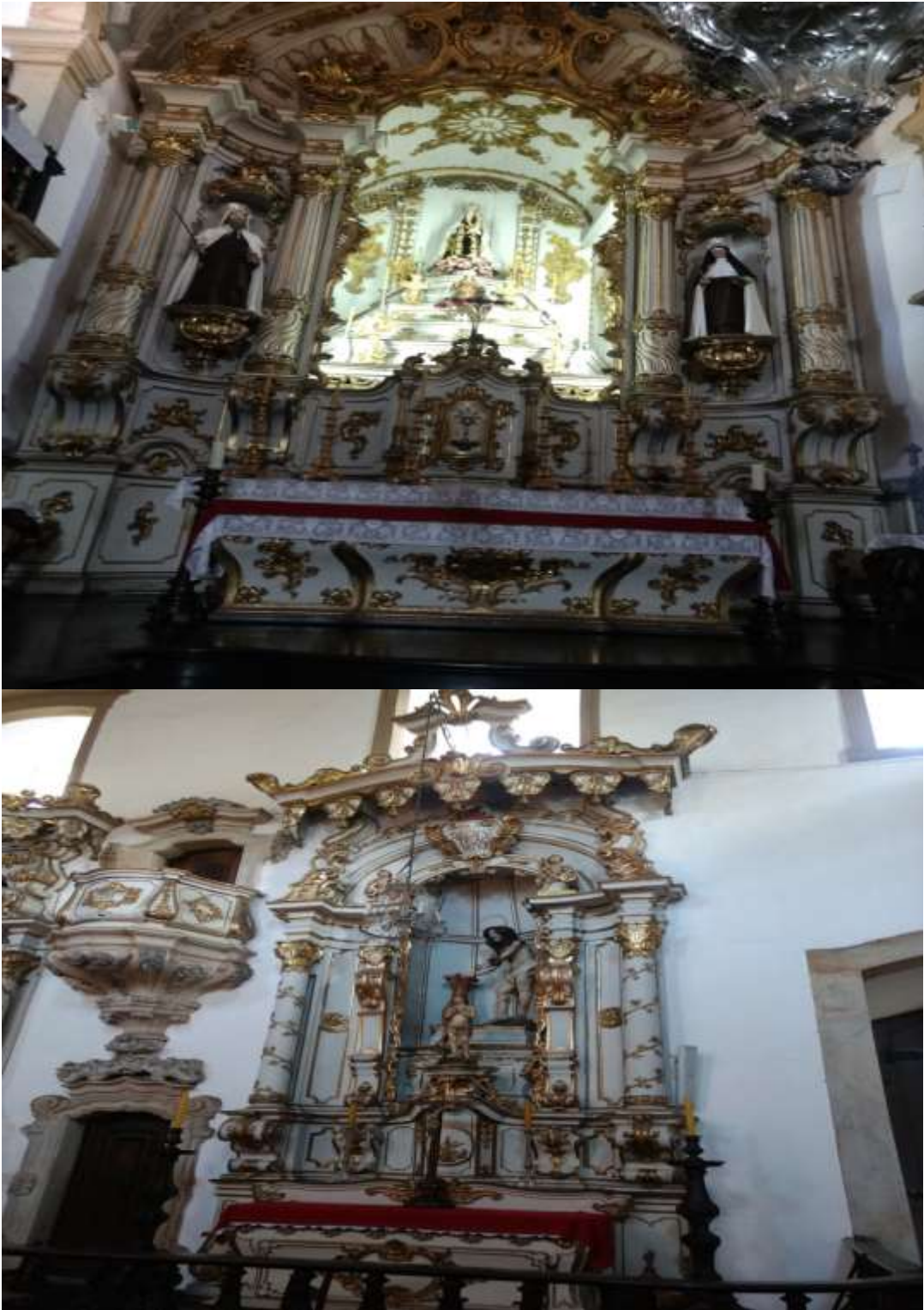
Figura 32 - Imagens internas do altar e lateral da Igreja de Nossa Senhora do Carmo, Ouro Preto-MG 06/01/19