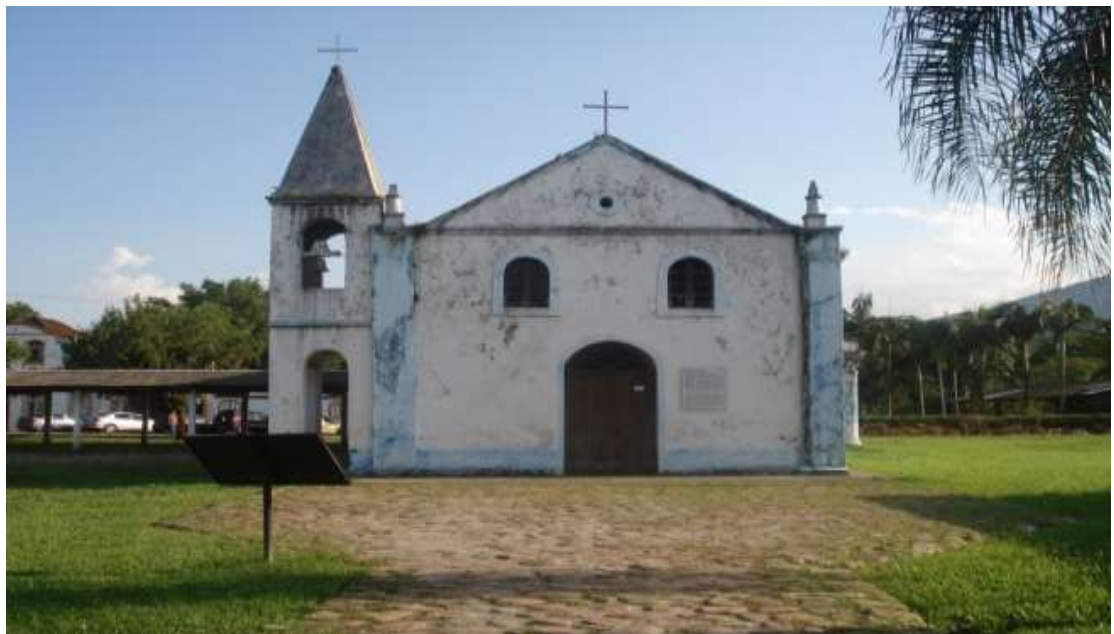
Figura 16 - Fachada Principal da Igreja de São Sebastião de Porto de Cima/Paraná, construída no século XIX.

A seguir, as imagens feitas por Martinez registram a exuberância da Igreja de São Sebastião do Porto de Cima.