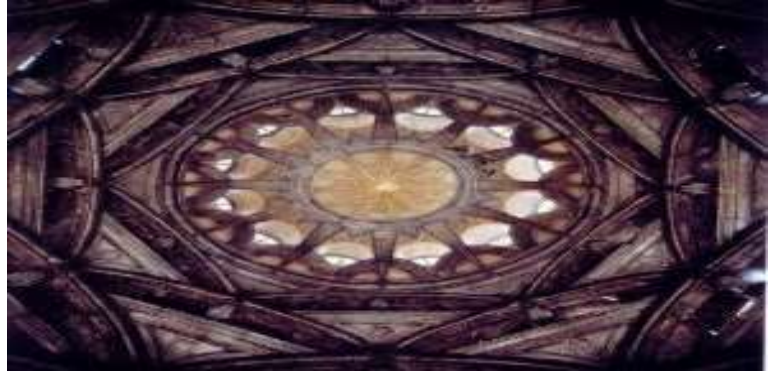
Figura 9 - GUARINO GUARINI. Cúpula da Capela de Santo Sudário, Catedral de Turim. 1668-94

A catedral de Turim foi construída no século XV, na área em que situava-se a Igreja Cristã dedicada a São Salvador, Santa Maria de Dompno e a São João Batista, sendo construída em um estilo florentino renascentista.