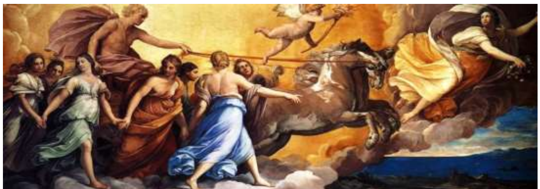
Figura 5 - GUIDO RENINI. A Aurora (afresco do teto), 1613. Casino Rospiglioso, Roma

Guido Reni (1545-1642): Proeminente pintor do barroco italiano, fez parte da Galeria Farnese, com destaque para sua obra "A Aurora", um afresco, mostrando Apolo no seu carro - o Sol – dirigido por Aurora. Para Janson (2001) “este traçado imitando relevo parecia pouco mais que um pálido reflexo da arte do Renascimento Pleno, não fora a brilhante e dramática luz que lhe dá um ímpeto emocional que as figuras por si jamais poderiam alcançar” (p.721).