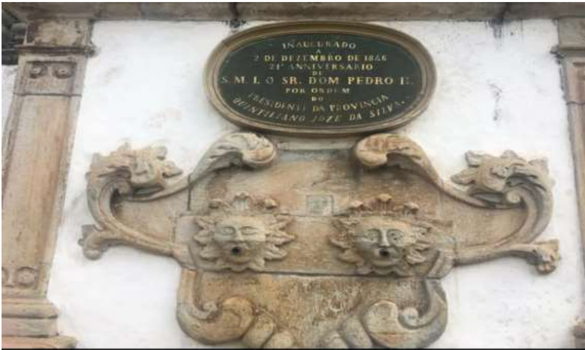
Figura 20 - Chafariz do Museu da Inconfidência, Ouro Preto – MG. Todo constituído em pedra sabão, representa o estilo barroco.

Em minha permanência na mesma percorri suas ruas e ladeiras, fiz questão de sair logo pela manhã da pousada onde me instalei e retornar ao início do anoitecer, pois tudo nessa cidade encanta, é uma memória viva da história da nossa sociedade, da nossa identidade cultural.