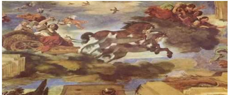
Figura 6 - GUERCINO. A Aurora. Villa Ludovisi, Roma

Giovanni Francesco Barbieri, Guercino (1591-1666): Natural da região da Emília-Romana, se destacou em Roma e Bolonha. "Guercino" é a palavra italiana para "estrábico", apelido que lhe foi dado por conta de seu desvio ocular. Sua obra "A Aurora", de mesmo nome da obra de Guido Reni, destaca-se em relação à de seu companheiro barroco, pois, de acordo com Janson (2001), "Aqui, a perspectiva arquitetônica, combinada com o ilusionismo pictórico de Correggio e a intensa luz e cor de Ticiano, convertem toda a superfície num espaço ilimitado" (p.721).