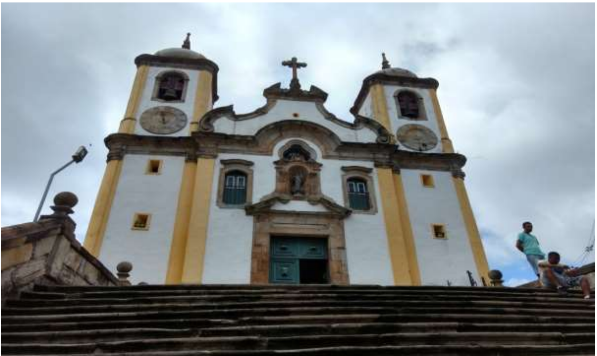
Figura 31 - Imagem da Igreja de Santa Efigênia, Ouro Preto-MG, 08/01/19

No caso de Minas Gerais, a irmandade mais antiga de que se tem notícia documental é a irmandade do Rosário, que se disseminou rapidamente por todo o território mineiro, não se