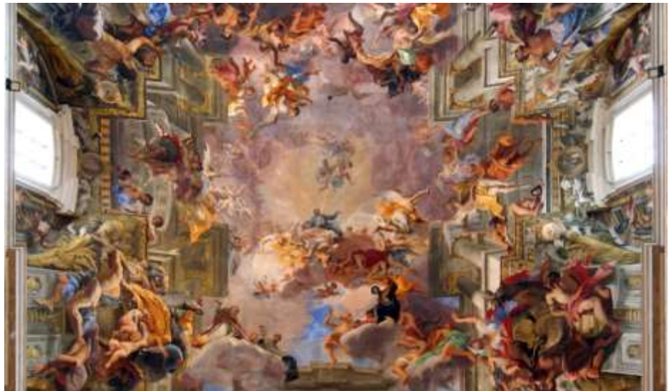
Figura 2 - ANDREA POZZO. A Glória de Santo Inácio, afresco pintado no teto da igreja de Santo Inácio, em Roma.

Andrea Pozzo (1642-1709): Foi um irmão jesuíta que trabalhou como arquiteto, decorador, pintor e teórico da arte, sendo um dos artistas mais notáveis do período barroco. Ficou conhecido principalmente por projetar obras de arte para a igreja de Santo Inácio em Roma, onde a obra A Glória de Santo Inácio , pintada no teto da igreja de mesmo nome, é uma de suas produções mais marcantes. Diz Santos (2002) que: “Essa obra impressiona pelo número de figuras e pela ilusão – criada pela perspectiva – de que as paredes e colunas da igreja continuam no teto, e de que este se abre para o céu, de onde santos e anjos convidam os homens para a santidade” (p.106).