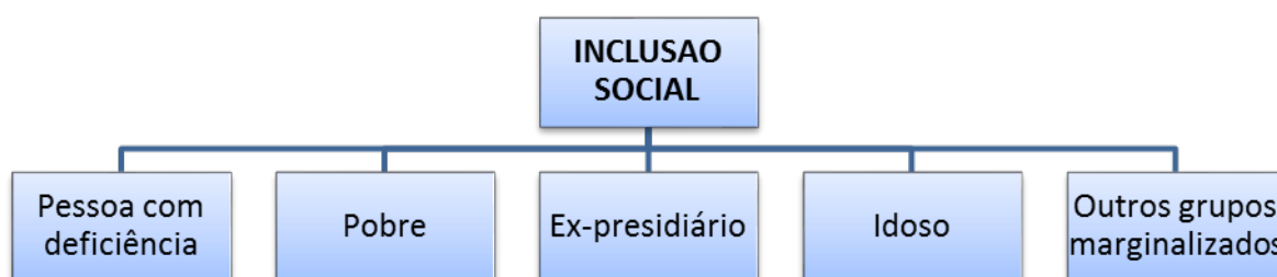
Figura 2. A inclusão social como grande área.

Ao ser realizado o estudo epistemológico da área da inclusão das pessoas com deficiência por meio de leitura de diversos textos especializados, consultas em sites, leis e especialistas, além da experiência pessoal da pesquisadora, observamos que essa área se insere em um contexto interdisciplinar, partindo de uma grande área que é a da inclusão social. Vale ressaltar que o conceito de inclusão social surgiu como tentativa de colocar em prática as discussões sobre a exclusão social , tema multidimensional que trata das pessoas com deficiência, da pobreza, dos imigrantes, dos ex-prisioneiros, dos dependentes químicos, dos idosos, entre outros grupos que estão à margem da sociedade: